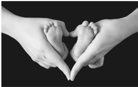
母親與孩子之間有著難以割捨的聯繫。

儘管涼香拚命地與家人劃清界線，她對家庭的情感仍然是深切的。那是一種攪合了愛意與憎惡的渾沌感情，卻沉重得令她再也承受不了失去，再也不想眼睜睜看著任何人離去。一如涼香相當依賴的貴賓犬即將壽終正寢之時，她要求醫美診所替狗狗修復皺紋，意圖抵禦歲月的流逝；也一如長年奉獻的司機退休之際，涼香坦白了自己對他的憎恨，用什麼形式都好，只圖能存留於對方的記憶裡。這個不甘寂寞的大小姐一味逃離家庭，一味揩去母親殘留在基因上的遺跡，即使最終演化成連人類都不如的怪物，也企求著「美」能填滿靈魂的空寂。