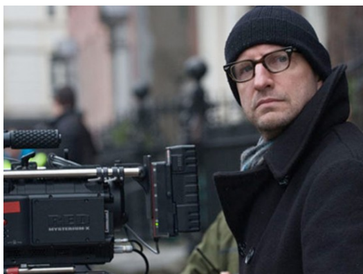
【性、謊言、錄影帶】導演史蒂芬·索德柏(Steven Soderbergh)。

【性、謊言、錄影帶】是由今日好萊塢名導，史蒂芬·索德柏(Steven Soderbergh)獨立製片時的處女作，並於1989年在坎城影展一鳴驚人，奪下金棕櫚獎，從此聲名大噪。