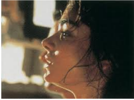
辛蒂亞與約翰激情過後留下了汗

【性、謊言、錄影帶】不僅是對人性秘密的一種探查，它還表達出了對人類普遍生存困境的反抗，像是善於偽裝自己的女主角安能在錄影中坦白自己的內心，是對自身的反抗；沉迷於影像世界的葛倫最後砸毀錄影機和錄影帶，這是對虛擬世界的反抗。他們由此握住了自己的內心，進而有力走向真實的自己。