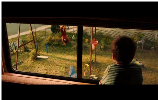
從不同觀點看世界，呈現當然也不盡相同。

兩部戲雖相隔十二年，卻有可相互呼應的橋段。斯派特在火車上看到穿著紅色衣服的女孩倒掛著盪鞦韆。這彷彿是艾蜜莉的化身，暗示派特要從不同的角度去理解世界，這世界不是全然理性的，認識世界有千百種方法。