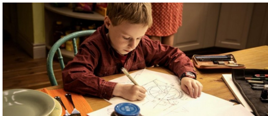
科學雖然可以讓斯派特解釋定律，卻無法了解人性。

【少】從開始到最後，都以主角視角敘事，觀眾可以融合自己的想像來解讀奇幻旅行。斯派特與艾蜜莉的個性也十分不同，派特喜歡運用邏輯的理性思維去探討人生問題，像是「水滴的特別之處在於它們總能找到阻力最小的道路，對人類而言，情況剛剛相反。」但若這句話給艾蜜莉來說呢？她應該會瞪大著眼睛看著觀眾說：「水很輕，很輕，她可以幻化成雲霧浮在天空，但她也可以很重，像是失戀人們的眼淚，再大的力氣都底擋不住。」