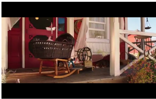
故事尾聲，熱內用改良過的永恆機的去象徵派特的轉念。

原以為科學真理會是能容納他的那棵松樹，可是大家雖肯定派特在科學上的創舉，但其實更想要因他而致富。最後，派特的爸媽將他帶回家，也了解爸媽與他之間的嫌隙是因為對彼此的愧咎而產生的。