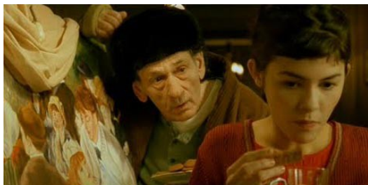
聽完老人的話，艾蜜莉衝出了家門，而發現她的白馬王子也在等她。

而艾蜜莉的社區中也有位老人，他足不出戶，但他知道艾蜜莉用她的聰明去化解鄰居們的煩惱，並使他們感到快樂，然而她卻不敢追求自己的幸福。老人有次遇到艾蜜莉說：「妳必須要行動，沒有愛會變得又乾又枯。」