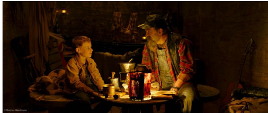
聽完回答，老船長知道少年還沒找到屬於他的松樹。

斯派特遇到一位老船長，老船長跟派特說了個故事：「有天，暴風肆虐，麻雀找了梧桐樹，想要在葉子中遮風擋雨，梧桐樹不答應，之後，麻雀又找了許多樹但是都遭到拒絕。最後麻雀找到松樹，松樹說它的葉子很細，無法遮蔽全部的雨水，假如麻雀不嫌棄就留下來吧。在松樹的保護下，麻雀躲過了暴雨。上天知道了這件事獎勵松樹，使秋天落葉的季節唯獨他能擁有樹葉。」這個故事是從船長的奶奶告訴他的，派特聽完便理性答道：「松樹的隔熱效果是無法使麻雀維持體溫的，因此你奶奶騙了你。」