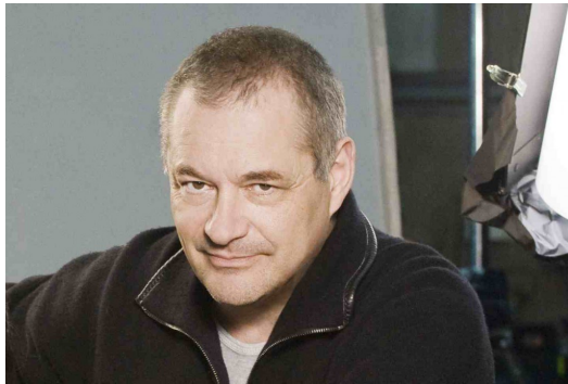
【艾蜜莉的異想世界】在法國凱薩電影獎榮獲最佳導演。

二〇〇一年，尚皮耶·熱內 (Jean-Pierre Jeunet) 以【艾蜜莉的異想世界】榮獲歐洲電影獎最佳影片。奇幻寫實類似後現代主義的藝術，反對用各種定義去框架任何事情，但是熱內的奇幻風格絕非亂無章法，他以衝突的角色安排去經營故事，並以鮮明的色調來營造氣氛。