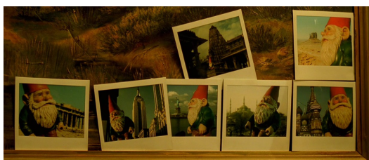
最後小矮人回到家中，父親轉念決定出門旅行。

艾蜜莉的異想世界也有派特的化身，那便是艾蜜莉父親的小矮人，父親有個矮人木雕，但他將木雕黏在庭院後便不再搭理，然而艾蜜莉為了讓爸爸的生活多些驚喜，偷偷地把小矮人交給空姐，並請她將小矮人放在世界各地合照，然後將照片寄回家中，父親看到之後驚喜不已。小矮人就像是派特，他從家裡出發，旅程中也讓父母驚訝及擔心，最後回到家中，父母親打開心胸後，氣氛也變得和樂融融。