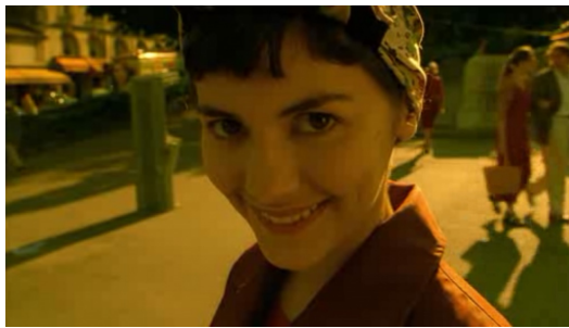
片中艾蜜莉會直接把心中的想法跟觀眾說，此手法在電影中並不常見。

艾蜜莉會對著鏡頭向觀眾說話，使觀眾感覺像在觀察她的生活，不同於一般電影讓觀眾投射自我情緒在主角身上，艾蜜莉用自己的看法詮釋身邊的人事物，包括用平靜的態度面對親人離去。