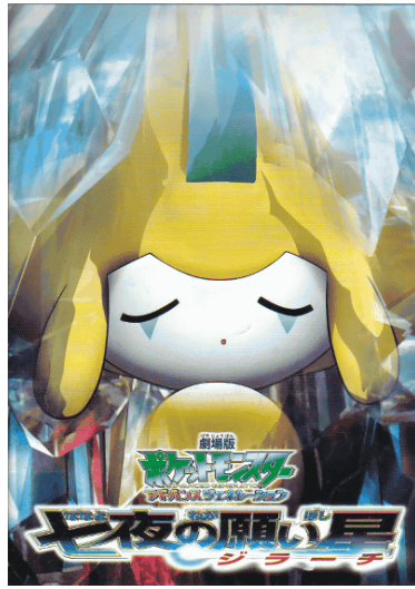
【七夜の許願星】電影海報