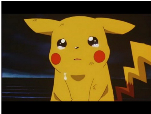
【超夢的逆襲】電影中，皮卡丘因喚不起主人小智而難過落淚。

在電影版【超夢的逆襲】當中，主角小智為了阻止「超夢」與「夢幻」的紛爭而變成化石，皮卡丘數次試圖喚醒，最後落下了眼淚，感動了在场所有原種與複製品的神奇寶貝，眼淚的力量匯集而成，將小智復甦。這一幕可以堪稱神奇寶貝電影版中最扣人心弦的一幕，神奇寶貝被描寫為非人類卻富有情感的生物，雖然人類的寵物良伴狗、貓等亦如是，神奇寶貝的情感卻借由動畫的表情描繪，更加深其動人之處，也擴展了人們對於神奇寶貝的想像。