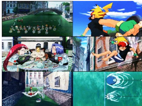
【水都的守護神】呈現濃厚的威尼斯風情

除了原本既定的世界觀以外，自第五部開始，電影版更引進不同國家的背景，如【七夜的許願星】中，基拉祈的原生地取材自中國湖南省一帶；【雪拉比 穿梭時空的相遇】背景參考亞馬遜流域的熱帶雨林；【水都的守護神】背景則是設定於義大利威尼斯；【比克提尼與黑英雄 捷克羅姆/白英雄 雷希拉姆】製作團隊更是造訪了位於法國南部的數座城市及著名景點。