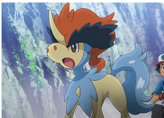
以凱路迪歐領銜主演的電影，主角小智淪為幫手角色。

而第十四部電影【比克提尼與黑英雄 捷克羅姆/白英雄 雷希拉姆】分版本上映的手法，更是首例，無非是利益所構成。接著隔年推出的劇場版【酋雷姆vs聖劍士凱路迪歐】，神奇寶貝凱路迪歐接管了以往人類主角小智的位置，成為劇情的主線角色，小智則完全淪為幫忙者。而凱路迪歐的角色設計也令人不悅，不僅是衝動和幼稚的個性，過於鮮明的外型也破壞了電影場景所能帶出的感受，也不難看出包括凱路迪歐在內的其餘三名聖劍士與酋雷姆，皆為整部電影所推銷的產品，實為可惜。