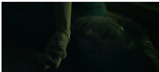
女鬼附身在小燕身上，使用了東西被扭碎聲、小孩慘叫聲、雜亂細碎的聲音。

「可怕的動作一定會用音效增強效果。」鬼片與搞笑片只是一線之隔，但最大的不同就是鬼片會在可怕的點，為演員的每個動作配上使觀眾不舒服的音效。劇中女主角小燕在被女鬼附身後，女鬼持續折磨小燕，使小燕在地上翻來覆去，這段使用了東西被扭碎聲、小孩慘叫聲、雜亂細碎的聲音，使觀眾心裡不舒服。