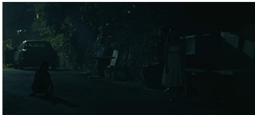
鬼小孩在路上等著拿紙錢，若沒有配樂，看起來只像是兩個小朋友在馬路上。

「可怕的點一定會有突然、驚悚的音效」這個技巧可以用小時候常玩的遊戲說明——突然出現在朋友背後，然後大叫一聲，這大多會使朋友嚇到。而【孟蘭神功】把每一個欲使觀眾害怕的點都配了突然、可怕的音效，像是開頭馬路上的兩個鬼小孩突然出現時，突然配上大聲的金屬撞擊聲。若缺少了這些聲效，觀眾也可能會以為只是兩個小朋友站在馬路上。