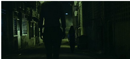
宗華和女鬼走在街道上，收錄了清楚的現場聲音，使觀眾身歷其境。

「清楚收錄現場的任何聲音。」現場音在鬼片非常重要，因為能使觀眾身歷其境、把自己想像成劇中角色，所以當鬼接近主角時，觀眾也會覺得鬼要接近自己。劇中男主角在深夜時，走在空蕩蕩的街道，而女鬼就走在她面前。收錄了他的腳步聲、呼吸聲，使觀眾將自己想像成與女鬼走在同一個街道的男主角。