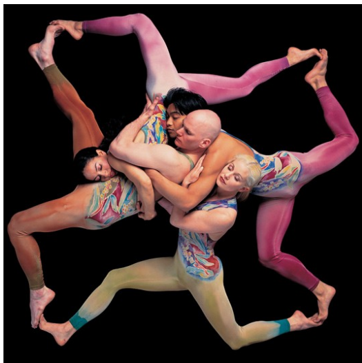
舞蹈與獨立搖滾樂的創意結合。

舞台上，電吉他、爵士鼓、銅鑼和嗩吶。西洋與傳統的結合，獨特的搖滾音樂風格。中西各有所長的文化融於一爐，將傳統樂器附於新的生命，這是現今社會傳統文化創新的一種。中國五千年的歷史，孕育了悠長的傳統文化，例如中國傳統藝術、中國醫學、中式傳統建築、國樂、傳統禮儀等，而這些傳統文化逐漸被人冷落。為了要讓更多人認識傳統文化，同時維繫傳統於不墜，因此現今傳統文化前面都會加上兩個字「創新」兩個字。