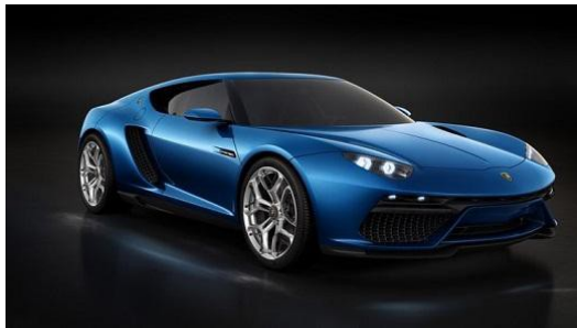
藍寶基尼(Lamborghini)概念車款Asterion LPI 910-4 Concept

在科技日新月異的年代中，已經很少有人願意保留創廠時的最初設計，將傳統元素不斷延續，不過義大利汽車品牌藍寶基尼(Lamborghini)概念車款Asterion LPI 910-4 Concept，則是藉由該品牌中首款搭載油電混合動力系統的車型，象徵傳統經典與創新科技的結合。另外摩根汽車(Morgan Motor Company)，卡特漢姆車隊(Caterham)至今仍對經典有所堅持。