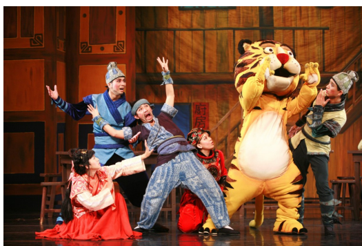
武松打虎，傳統中極富創新的舞台演出，適合全家觀賞。

傳統文化的傳承與創新，也是為了對歷史遺留文化的繼承與發揚，在此基礎上進行有建設性的改進與發展，也就是創新。文化的創新卻非簡簡單單就能繼承全部，而是有原則性的揚棄，用一句俗語說，就是「取其精華，去其糟粕」。但是若是沒有經過對舊文化有選擇性的繼承就進行的創新，往往是站不住腳的。以人為本，以社會核心價值指引的創新才能促進傳統文化再次的蓬勃發展。