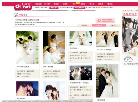
許多情侶、夫妻透過網路建立了長久的愛情，也在網路上分享他們的愛。

儘管潛藏許多不可預測的風險，但仍有許多成功的案例。根據臺灣知名交友配對網站愛情公寓（i-Part）資料顯示，從網站成立至今，已促成數千對戀人，有些甚至步入婚姻。因為網路或交友軟體而認識另一半的比率逐年增加，這樣的現象不只發生在年輕人，許多中年人也加入了網路和軟體交友。網路愛情似乎不再如其名般的虛幻，這樣的情感也可能開花結果。