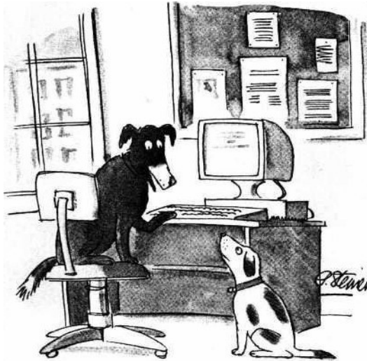
網路上沒有人會知道你是一條狗，因為網路提供了強大隱匿性。

對於不認識的陌生人，第一印象總是非常重要的，人們往往會很直覺地以對方的長相，在心裡暗自幫他進行歸類，在透過與對方的交談後，才能更深入了解對方與想像中的異同，進而有了情感與互動。依著自己心目中喜歡的長相來評斷陌生人並不是一件錯誤的事，這是出於人的本性，但在社交網站及交友軟體的催化下，只靠外貌認識對方的想法似乎被更加強化。