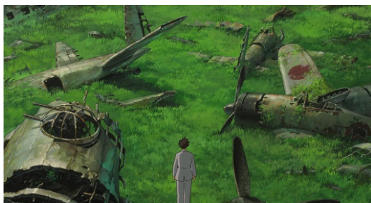
影片到了尾聲，二郎踏過滿是戰機殘骸的草原的這個畫面格外發人深省。

對於過去日本在戰爭所帶來的痛苦、哀傷等陰暗面，還有二郎設計出的是「飛機」還是「殺人機器」，藉著片中「飛機是個美麗而受詛咒的夢想」這句卡普羅尼對二郎說的話，不以正面描繪，作者不帶任何想怪罪誰的立場，呈現的反而是二郎單純對夢想的追逐，和專心設計飛機的過程，所以二郎在劇中說：「我唯一想做的事情就是打造一台美麗的飛機。」如此一來，這部作品在不同年齡便會產生不同層次的內涵，轉移了焦點之後的【風起】，對於小孩子來說，產生的是忠於逐夢的正向意義；而對於大人，則是體會那些戰爭武器設計師的心情處境。