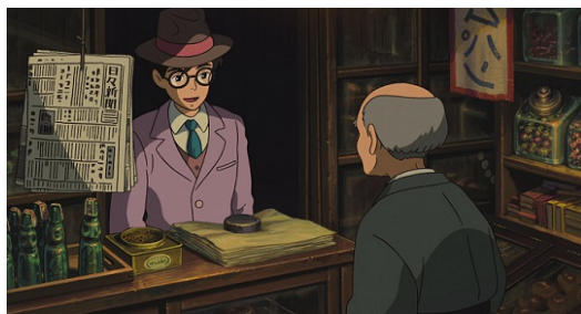
細膩的畫風，把上個世紀初復古的柑仔店和穿著復古的爺爺呈現在觀眾眼前。

承襲著過去一貫的精緻畫風，每一幕都有一幅美麗的畫停在眼前。而一九二〇年代的東京也在宮崎駿的筆下被細膩地呈現出來，像是二郎出生的大正時期，人們就穿著專屬於那個時代剪裁的衣物；時間再往後推移，二郎剛出社會時正遭逢金融大恐慌，當時的城市充滿洋風的建築，還有路上開始穿著西裝的人們，都一一地在眼前呈現。除此之外，二郎從年輕到後期的交通工具也從陽春的蒸氣火車進步到不需蒸氣的電氣車頭，處處可見作者在時空背景再現上的用心。