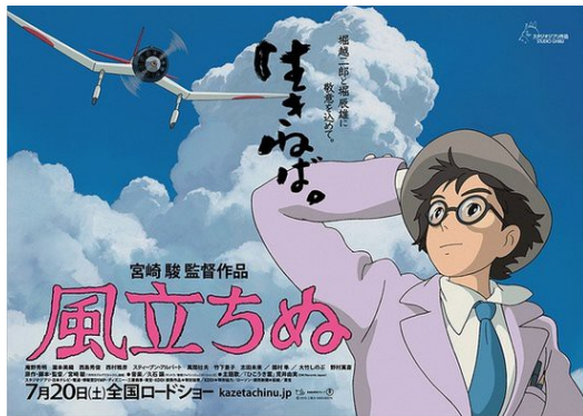
【風起】入圍第七十屆威尼斯影展競賽片，在日本也交出七周票房冠軍的亮麗成績。

這是動畫大師宮崎駿在二〇一三年夏季推出的動畫長片【風起】，結合了零式戰鬥飛機的航空工程師堀越二郎和小說家堀辰雄的中篇小說《風起了》，為宮崎駿第一次以真實人物為素材的創作。