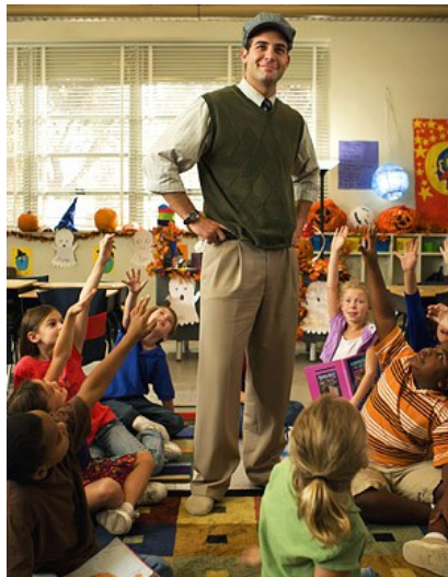
Brad的引導式教育，讓學生勇於舉手發言，並學習課程之外的道理。

【叫我第一名】除了讓外界了解什麼是妥瑞氏症外，更讓觀眾學習到「別讓任何事阻止你追尋夢想」的態度。