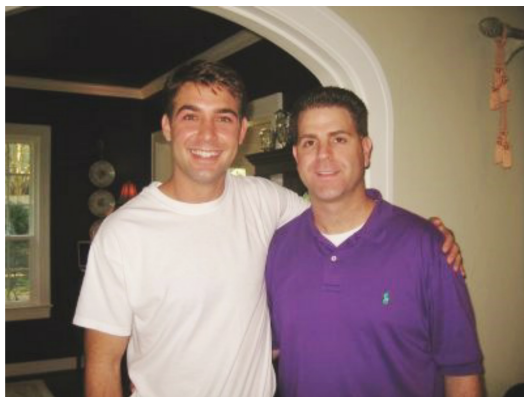
Brad Cohen (右)是由Jimmy Wolk (左)所飾演。其精湛演技讓Brad本人大讚：「太像了」

【叫我第一名】(Front of the Class)是一部真人實事改編的電影，運用輕鬆的劇情、幽默的對話，以及追尋夢想的主軸，帶領觀眾進入主角Brad Cohen的故事。