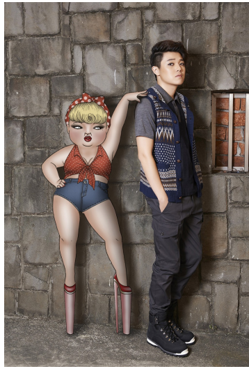
美美與知名時尚雜誌合作，共同拍攝系列畫報。