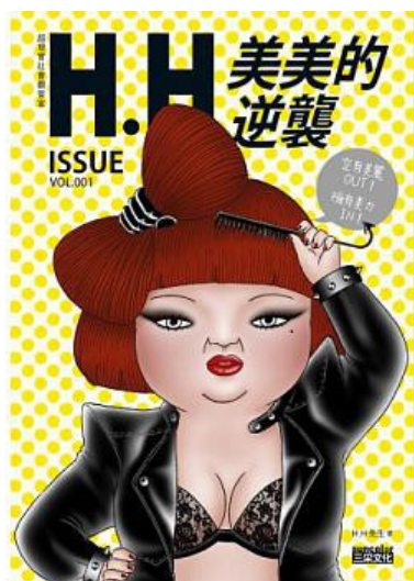
《美美的逆襲》一書運用風趣的圖文故事，反諷當今的網路文化與社會現象。

隨著社群網絡的興起，許多插畫家藉由建立臉書專頁分享作品，而經由網友的分享與轉載，便得以快速累積忠實粉絲並提升作家知名度。《美美的逆襲》就是在這樣的環境之下所誕生的一本具有插畫家意識的風格圖文書，當紅網路作家H.H先生在個人的臉書專頁吸引近一百萬的粉絲按讚關注，其作品中的靈魂人物美美更是擄獲了許多讀者的心。此書將關於美美的相關創作集結成冊後出版發行，除了供粉絲收藏用途外也使得更多人有機會去體會美美無窮的魅力。