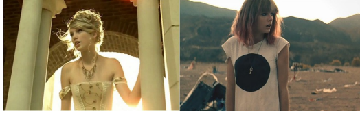
泰勒絲前期情歌較為浪漫，後期則較多描述愛情痛心的一面。

或許有許多人像泰勒絲一樣，經歷過感情的失敗後，看到了愛情最現實、最醜陋的部分，對愛情不再只有美好的詮釋。若從中領悟出一些道理，並成為振作的力量，則稱之為「長大了」；若深陷其中，無法釋懷，也有人稱之為「夢碎了」。〈I knew you were trouble〉的MV裡面有一段泰勒絲的口白，其中一句：“I think that the worst part of it all wasn't losing him, it was losing me.”（我想，這段感情裡最糟糕的部分，並不是失去對方，而是失去自我。）我們應該讓「心碎」成為值得慶賀的成年禮，而非築建厚牆的心魔。