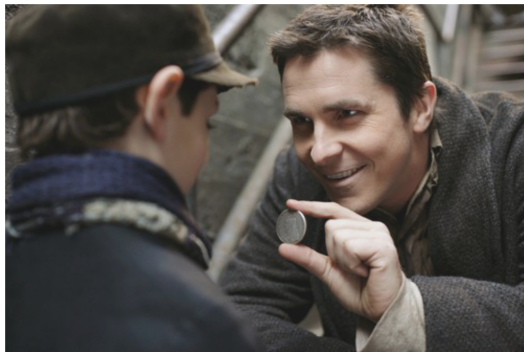
小男孩以天真的眼睛識破波登的戲法，「而你，看清楚了嗎？」

再篤定的推測，也可能被一舉推翻、而原以為不可能如此單純的，卻偏偏就是真相。投身於劇中情節的觀眾們將會明白，被【頂尖對決】以高明的敘事手法一次次矇騙的自己，正是在觀賞一場長達兩小時、卻絕無冷場的魔術表演。如同當年倫敦的魔術迷們，甘願投注時間、金錢與全副精神，只為好好地被「騙」上這麼一次。