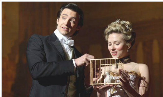
魔術，具有令人目眩神迷的魅力。

刀劍穿刺下毫無懼色的箱中美人、憑空消失，而後再次出現的兔子與白鴿；談及魔術，眾多五光十色的場景便在人們心中湧現。無論是魔術師職業本身的神秘感、戲法虛幻迷離的特質，亦或表演背後暗藏的諸多潛規則，許久以來，都使魔術題材成為眾多影視作品的寵兒。