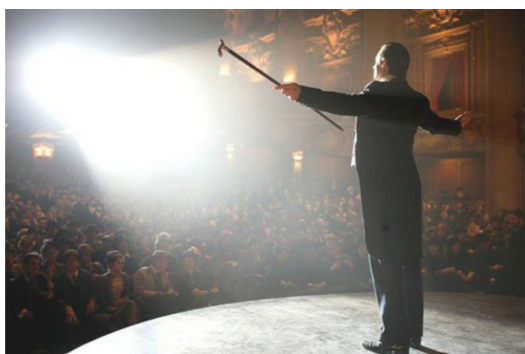
謝幕時，接受群眾的喝彩固然滿足，卻也預告著散場的寂寞。

「你不明白我們為什麼要作這些。觀眾們了解事實：這個世界很簡單、充滿痛苦，什麼都冷酷無情。但如果你能騙過他們，即使只騙過一秒鐘，你就能使他們驚嘆。而你，也就能看到非常特別的東西。那就是：他們臉上的神情。」片末，身負重傷的安傑悠悠地吐出這麼一段話，也道盡無數舞台表演者的心事。帷幕升起，他們燃燒生命的熱力、傾注所有，為觀眾創造出精采絕倫的夢境；幕落，卻自己承受心中的空虛與扭曲。越是寂寞、對掌聲越是深切渴求，也便越容易忘卻對表演的簡單熱忱，在名利場中迷失自我。