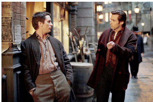
命運，對同門學藝的兩位年輕人開了場殘酷玩笑。

【頂尖對決】將背景設定在維多利亞時期的倫敦。人們呼朋引伴、觀賞一場場魔術表演，風靡程度不亞於今日的社交派對。群眾的推崇中，並立於魔術界頂端的兩位新秀，分別是自負而才華橫溢的波登(Borden)，以及務實平庸、卻擅長迎合觀眾喜好的安傑(Angier)。