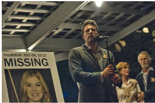
透過螢幕塑造的大眾觀感對案件有極大的影響力。

【控制】藉著尼克的遭遇，來諷刺現今社會充斥的媒體亂象和盲目跟從的社會大眾，引領觀眾仔細思考，自己是否潛移默化地受媒體影響而隨之起舞。