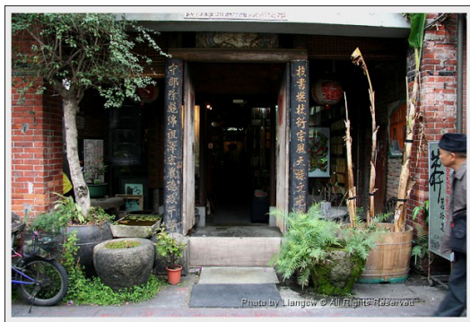
社區的小書店是地方的文化中心之一。

書店產業的危機怪罪於閱讀習慣的轉變的同時，或許可以從《A.J.的書店人生》得到一些啟示，比如A.J.如何把書店變成重要的地方中心，吸引絡繹不絕的讀者；如何用對地方特性的掌握，打敗大型連鎖書店的削價競爭，這也是每一家努力維持生存的地方書店可以思考的方向。