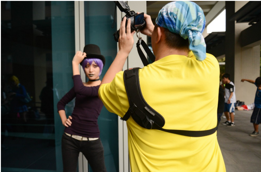
角色扮演的同好也包含了攝影師。Coser和攝影師之間會互相交流、合作，共同拍出心目中的角色印象。