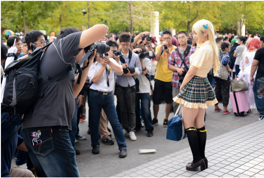
在廣場，時時可見扮相逼真的Coser面前，有道攝影師人牆正進行拍攝，用鏡頭抓住Coser的風采。