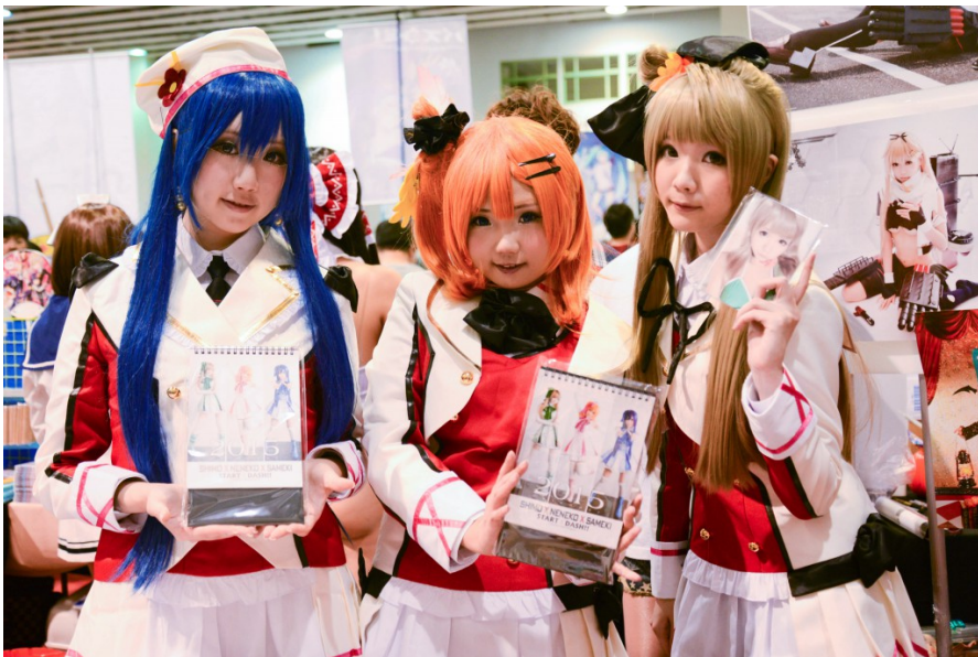
近期臺灣有越來越多Coser將自己的作品製作成寫真書、海報、明信片.....等具有收藏價值的形式， 在活動會場內販售。