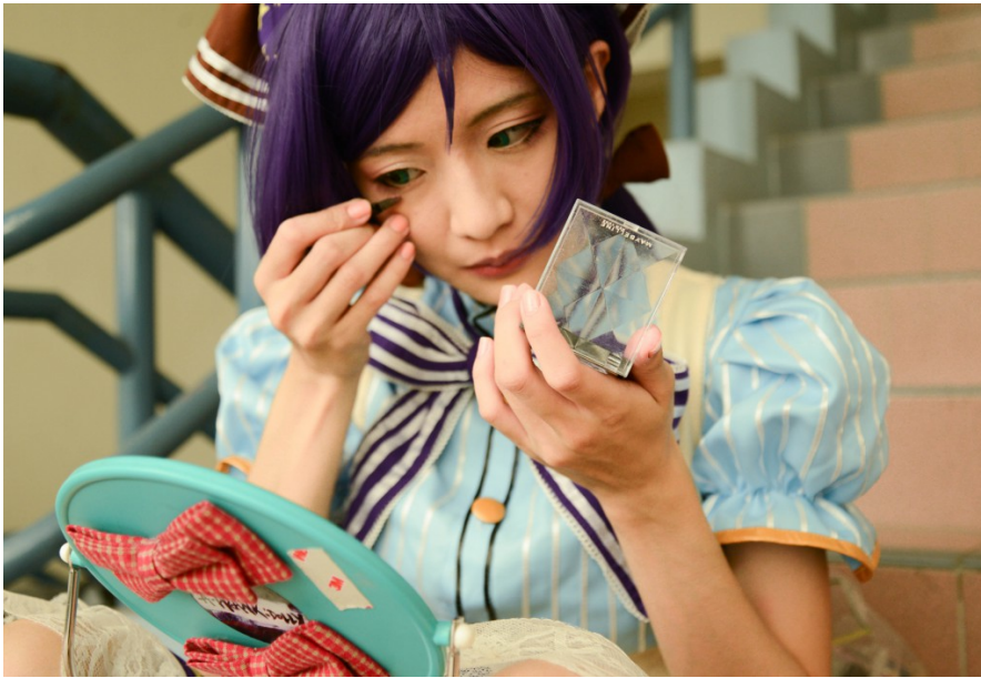
扮演東條希的造型張羅方面，包括妝容、髮型、衣服和配件，都是由葦子自己一手打理的，準備期間大約為一個月。期間內，因為深深喜愛著這個角色而享受準備的過程。