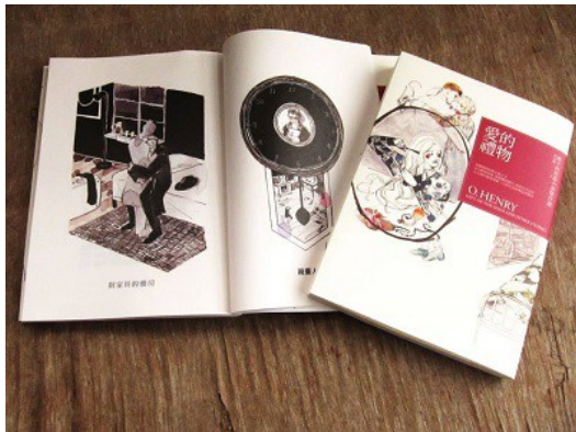
《愛的禮物》一書封面、內文以及封底連貫的手繪風呈現一種優雅的質感。

這十六篇短篇的故事當中，每一篇皆洋溢著不同的感情，甚至帶來不同的寓意。在描述愛情的篇章中，有的只是簡單描繪小倆口在生活裡的小美好，卻能為心靈注入一股暖流；有的戀人生活沒有那麼幸運，經濟拮据的他們掙扎著為著彼此著想，讓人看見愛情的力量之餘，也為當下社會環境所造就的結果感受到一絲絲心酸。而在友情的內容中，看見的則是情誼不因時光改變，但是人事卻不再單純的那種宿命之感。