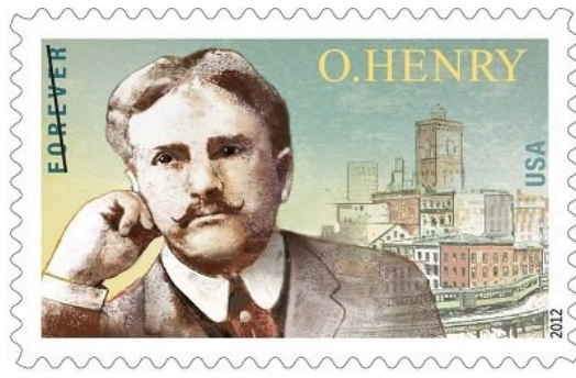
世人肯定作者歐亨利的價值，在他過世一百周年時，美國郵政總局發行了紀念郵票。