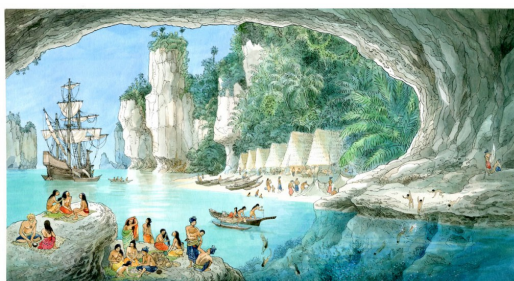
與自然和平共存的歐赫貝式生活。

另一方面，在歐赫貝的世界裡，可以從主角和各國人民的生活作息中，體會到他們與大自然的呼吸頻率相同，並與之和平共存的生活哲學。