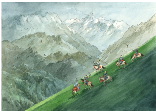
讀《歐赫貝奇幻地誌學》，彷彿經歷一場奇幻旅程。

歐赫貝的世界替作者傳達出了一種純淨的世界觀，那是個在現代紛紛擾擾的社會下，依舊在心中還保留著一片淨土的堅持。走在歐赫貝的國家裡，可以體會到與現實社會相似的幻想民族風貌，暫時性地抽離生活上的繁雜事務，如同到另一個世界做一場洗滌心靈的文化之旅。