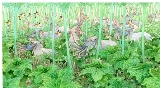
棲息於書中的奇珍異獸。

獨角戰獸、長途鳥、刺蛇、木面具麋鹿……許多奇珍異獸都躲藏在頁面與頁面間等著被發現。紀錄高山流水之餘，此書還記載了珍獸，又附加像夸父逐日的純真、精衛填海的堅定意志等情節，於是讓人十分輕易地聯想到中國先秦時期的著作《山海經》。不過不同的是，《歐赫貝奇幻地誌學》是屬於全然幻想的境域，且在故事背景上還染上了一股中古世紀的歐洲風采。