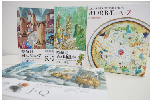
《歐赫貝奇幻地誌學》是一本以想像場景為架構的地誌學。