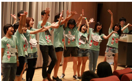
二〇一三年交大傳科營。阿比覺得很值得也很慶幸有參加傳科營， 才能與許多同學、學長姐變熟。

阿比的系上就像是一個大家庭，大家都互相認識對方，這些人總是陪著阿比經歷生活的大小事。有朋友在阿比心情不好時，就算忙得不可開交，也會擱下外務，陪阿比花上大半夜喝酒；有朋友在想放鬆時，就一起學著校狗阿福，躺在圖書館外面曬太陽、享受溫暖的風；有朋友想聊天時，就一起聊天到凌晨四點，然後隔天一起昏昏沉沉的上課；有朋友想要拍片，就一起花上一整個暑假，完成四部微電影。這些朋友就像是家人一樣，給阿比力量與溫暖。