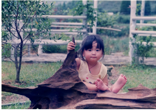
小時候的阿比常常因為一些簡單的事情而快樂。