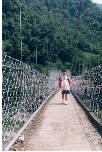
阿比第一天上小學，走在吊橋上， 爸爸、媽媽把阿比打扮得很漂亮。