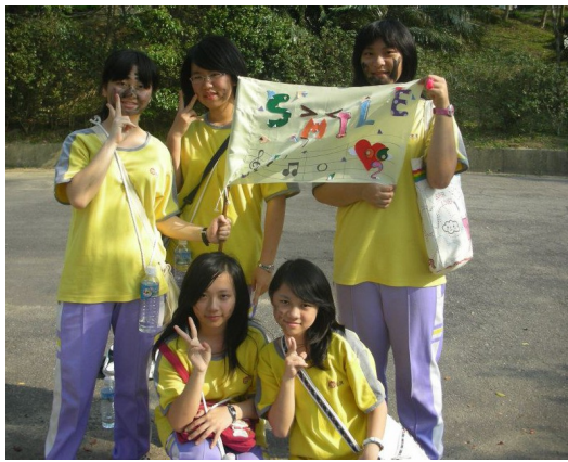
國二時的童軍露營，第一次外宿。

阿比很喜歡寫作文，因為寫作文是在忙碌又壓迫的生活中，比較能思考與想像的時候。阿比能夠寫下自己與眾不同的思想，天馬行空的想像自己是天空中的飛貓、在海裡的巨大馬爾濟斯犬，可以把很多自己異想天開的東西呈現在作文中。國文老師曾經誇讚阿比：「妳竟然想得到這些東西，真的很特別。」阿比發現原來和別人不一樣，能看見更多別人看不見的東西。