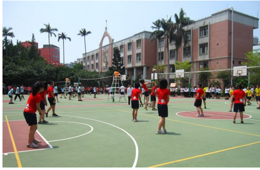
高二班際排球比賽，當時雖然沒有打進冠軍戰， 但比賽的感覺是難得猶榮。