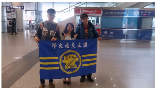
陌生的三人一同前往未知的國度，展開充滿冒險的旅程。

拖著沉重的行李箱，緩緩地走向校門口，大家還沉浸在睡夢中時，三位大學生坐上了飛機，離開美麗的故鄉，台灣。經過繁複的申請程序、多個星期的交流討論，原本互不熟悉的三個人，二男一女的組合，在緣分的牽絆下，一同踏上了中國大陸這塊陌生的土地，享受一趟未知的旅行。