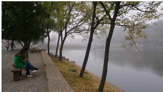
黃花灑落在人行步道及湖面上，形成漂亮的景色。

湖畔旁，柳樹隨風搖擺，葉梢插入湖水中，呈現一幅美麗的景色，人行步道旁的黃花被風吹落，點綴了綠油油的草皮，金黃色的樹葉鋪在地面上，為大地的衣裳增添了许多色彩。