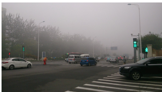
在外地人眼中覺得美麗的霧霾，是當地人的一大困擾。

白霧環繞四周，彷彿置身天堂仙境。周圍的高樓隱身於濃霧之中，遠處有人揮著手，迎接著我們三人，那是一群熱情活潑的大學志工，將歡笑聲混雜於霧霾之中，歡迎著我們來到天津。走踏在天津市區的街道上，如置身於地球另一端的英國倫敦，「霧都」之名似乎更適合現在的天津。