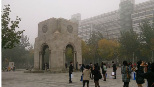
美麗的校園及悠閒的氣氛，是天津大學給人的第一印象。

整齊的人行步道和充滿歐式風格的建築並立兩旁，學生們騎著腳踏車，不疾不徐，彷彿置身於歐洲的街道巷弄。漫步在天津大學校園裡，沒有大陸高考壓力的氛圍，卻有著輕鬆愜意的步調。