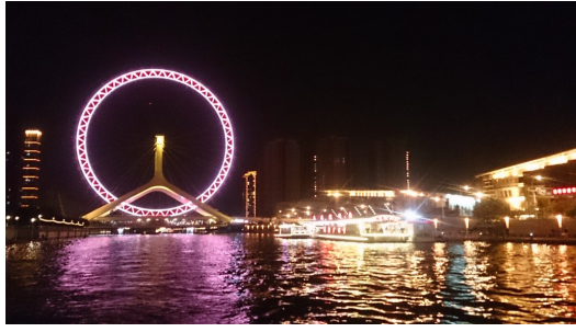
天津之眼讓海河在夜晚中更加美麗。

天津的命脈。自古以來，海河如同母親般孕育著天津的繁華，也陪伴這座城市走過每段高低起伏的歷史。河流的支線像微血管般貫串整座城市，人們在河岸旁經商貿易、建立家園，將自身與海河緊緊地結合。