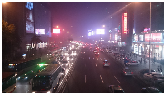
在現代化的大樓及充滿著招牌燈飾的商場點綴下，整座城市被賦予了生命力。

然而，霧濛濛的景色使我們感到驚奇與讚嘆，對當地人而言，卻是揮之不去的惡夢。在自然條件及重工業開發的影響下，近幾年來，霾害情形十分嚴重，街道兩旁的商場和高樓皆置身於霧霾，更常因視線不良，造成許多意外。聽聞霧霾對人類身體的危害，三人紛紛戴上了口罩，走在街道上，眼前原先讓人感到驚艷的朦朧美，頓時黯淡了許多，心中也為這「人為」的美景感到難過。