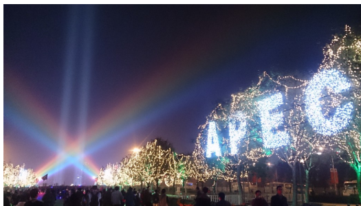
北京政府正積極演練著今年底的APEC論壇。

現在的北京，依然繁華壯麗，但卻不再只是個古代大城。透過各式活動的承辦，北京積極轉型為具領導地位的現代化都市。六年前的世界奧林匹克運動大會讓眾人見識到中國的實力與企圖心，今年的亞太地區經濟合作貿易協議論壇(APEC)也即將在此舉行。面對這樣世界性的活動，北京正積極的轉變它的面容，試圖給予世界各地的造訪者一個嶄新面貌。北京不只是個見證興衰的輝煌遺址，它的生命力依然旺盛，並且蠢蠢欲動。