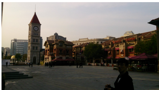
雖在中國卻又如置身歐洲的戶外廣場，是中西融合的體現。

搭上長途巴士，駛過好幾里道路，三人來到了過去列強的租界地。周圍的風景，令人感到困惑。明明身處在雄踞東方的中國大陸，身旁的建築卻讓人彷彿置身歐洲的露天廣場，牌樓鐘塔林立，巴洛克式的房屋一一排列在道路兩旁。過去的歷史或許充滿了戰亂與爭權奪利，然而，留下的並非只有痛苦的記憶，多元並存的文化無意間賦予這座城市新的面貌。