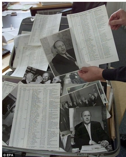
關於辛德勒的資料以及一千多名猶太員工的名單。

即便如此，辛德勒的名單確實挽救了一千多名猶太人免於大屠殺的命運，而萊昂·雷森作為倖存者，親身經歷與親眼目睹，就是最好的證明。