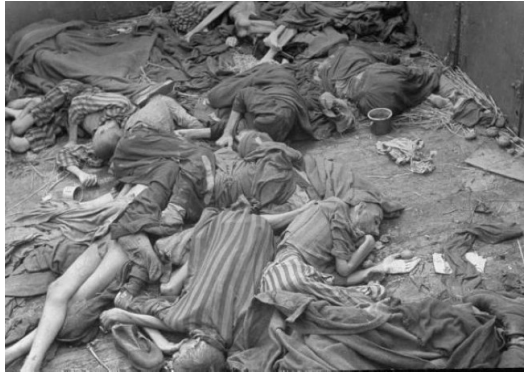
當時在集中營的慘狀，猶太人各個骨瘦如柴。