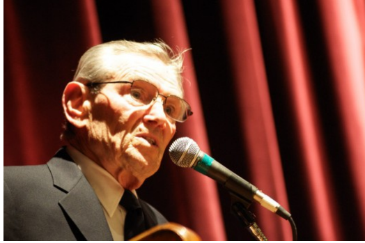
萊昂·雷森透過演講，揭示猶太人屠殺的悲痛。

回憶一次，就想到兩個因納粹而逝世的哥哥。一九九三年，電影《辛德勒的名單》上映，提醒了世人這段揮之不去的歷史陰霾，而身為辛德勒名單中最年輕的一員，萊昂·雷森也透過著作、演講與教育，分享他的故事，直到二〇一三年去世。