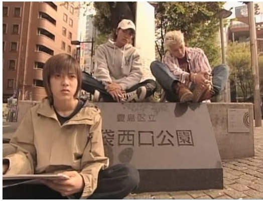
《池袋西口公園》翻拍日劇，實地到池袋取景。