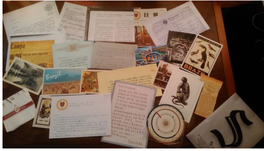
《S》中所附錄的23種道具。

《S》透過真實的筆觸與非凡的閱讀經驗，引領讀者回憶第一次觸摸書頁的感受，像個充滿好奇心的孩子，用自己的方式摸索書籍。作者希望讀者能夠在閱讀中享受最純粹的快樂，並重新建構自己與紙本書的關係。在數位匯流的時代下，《S》在電子閱讀年代的突圍，為出版界創造了不同的可能，讓紙本書仍有機會保有令人難以忘懷的深刻。