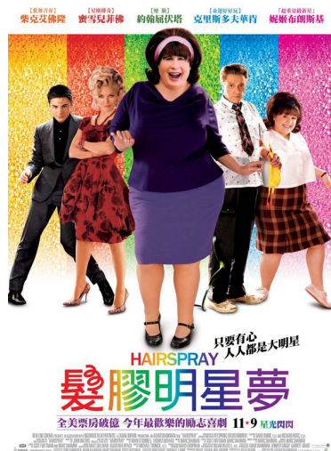
二〇〇七美國電影【髮膠明星夢】中六〇年代的造型，將復古流行風潮推向高峰。

二〇一四年的臺灣電影【大稻埕】，同樣以二〇年代作為背景，當時珍珠與繡花是中國女人穿著常見的元素，電影中也能明顯看出這個特點。但女主角穿著的貼身旗袍卻飽受批評，因為二〇年代為解放的時代，寬鬆剪裁的服飾才是當時人民的主流穿著，由這點可見，現代民眾對復古已經有一定的興趣與認知，復古的潮流已在無形中侵入人民的生活。