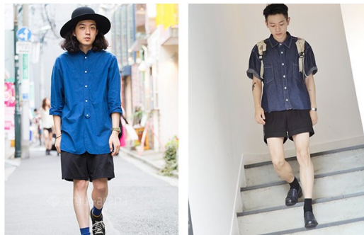
「古著」是指穿著與現代流行風格不同的舊年代服飾。

然而，今日年輕人對古著卻有更廣泛的定義：「有強烈個人風格而且穿得有自信」、「可以把很舊、很醜的單品搭配得很好看」，甚至有更概括的解釋，像是「復古的服裝就是古著」，因此在沒有明確定義的情況下，這些定義雖然讓古著風氣顯得更有特色，但也容易使接受的族群受到侷限，而成為次文化。