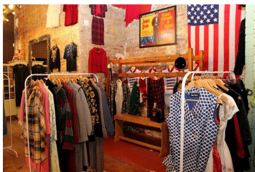
現今有許多復古專賣店，在其中可見直筒剪裁、普普風圖案、高腰造型等古典樣式的服裝。

儘管當今社會對復古沒有非常明確的定義，然而它對現代服裝的影響卻不可忽視。現在大至知名品牌，小至路邊攤都可以看到許多直筒剪裁、普普風圖案、高腰造型等古典樣式的服裝。這些風格的服裝在社會上的接受度也漸漸提高，而不是只在伸展台上供視覺欣賞而已。