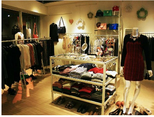
國高中時期的我不惜花光零用錢，只為了買最流行的服飾。

其實我也曾想過，買了一堆自己並不需要的東西，背後的動機到底是什麼？也許是同儕之間互相比較的壓力作祟；也可能是小時候的被迫壓抑而導致後來變本加厲；又或許我只是想藉由購物，來建立自己在他人眼中的獨立形象。不論原因是哪一個，我還是一步步掉進了名為「不知足」的物慾黑洞之中。