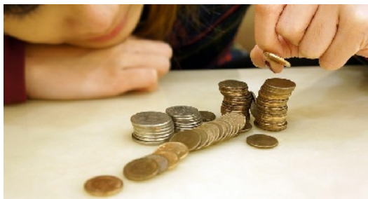
小時候只要有幾個銅板當零用錢就是最幸福的事。

直到上了小學高年級，爸爸才開始給我零用錢，讓我學著去支配「自己」的錢。還記得那個時候天真傻氣的自己，只要手頭握著幾個十元硬幣就開心的不得了，和鄰居的小孩一起去逛雜貨店，買喜歡吃的糖果餅乾，對當時的我來說簡直就跟買到稀世珍寶一樣偉大，即使現在看來這種喜悅微不足道，卻是我童年時期最純粹快樂的一段回憶。