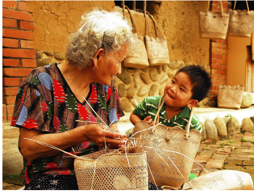
書中瑪德蓮與湯姆的相處像祖孫一樣，他們在彼此身上找到對於親情溫暖的慰藉。