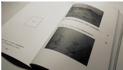
賴彥安在獨立雜誌《L( L ) 006：鹽鹼地》中的專欄〈生分〉。

她獨特的思維下，所畫的插畫被獨立雜誌相中，邀請她在雜誌上進行著專欄創作。這位二十一歲的插畫家少女，把自身的經歷稍微修飾並躍於紙上，引起讀者們的生命經驗的共鳴。