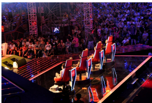
知名選秀節目的評審椅背對參賽者，面對觀眾。

另外，書中提到的「月暈效應」也是司空見慣的社會現象。作者提出「為何長相好看的人容易事業有成？」這個問題，說明我們往往會迷失在某個觀點上，並用這個觀點去設想事物的全貌，就如光是美貌或帥氣這個特點，就會使人對於這整個人也持有親切、聰明等正面評價。這與「刻板印象」的概念有異曲同工之妙。或許熟諳人類這項弱點，聘用擁有正面形象的代言人成為廣告界流行多年的行銷手法，以期藉此提升產品或品牌形象。近幾年受歡迎的知名選秀節目，也為了避免評審以貌取人，而想出了椅子背對參賽者，面對觀眾的規則，這項突破也引起各大節目爭相仿效。