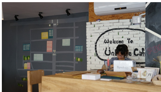
“Unbiggie Cafe”是他們現在的辦公地點，是一個可以邊享受咖啡，

提到近幾年的規劃，他希望能夠號召更多有志願、有理想的人，來尋找、創造更多的小人物，並藉由《Unbiggie》雜誌讓這些故事能被大量地分享，使越來越多的人可以因此得到鼓勵。「如果我能夠幫助這個人，那我絕對不會讓他在我眼前倒下。」假如能讓更多人知道這種想法，那麼社會也會更加進步。