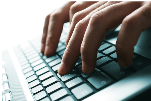
打字是我出聲的方式。

我的雙手很盡責，永遠忙著幫主人「說話」，而當年那一分鐘八十餘字的中打頻率，便是傾吐的速度。