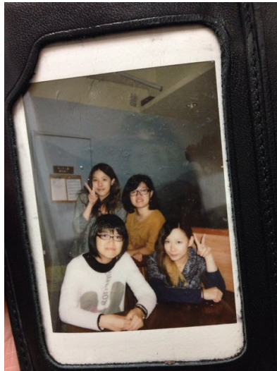
網路已然是生活的重心，透過網路認識的朋友越來越多。