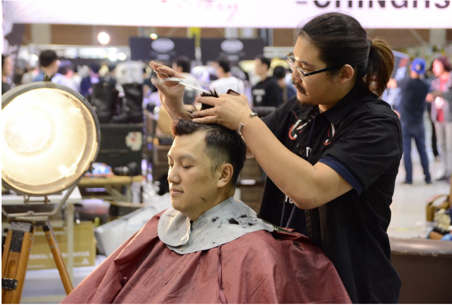
專業髮型設計師在現場為民眾操刀，剪出具有美式風格的騎士油頭。（照片來源／吳建勳攝）

身為街頭文化元素之一的刺青藝術，也沒有在這次的展覽中缺席。在展場中，刺青師傅專注地在民眾的皮膚上，刺下獨一無二的圖紋。（照片來源／吳建勳攝）