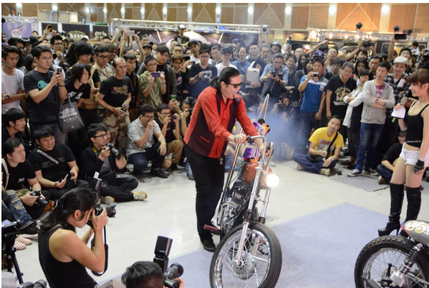
展覽最後的表演Full Throttle Showdown，由車友們帶著愛車相互較勁，比誰的拉轉聲最能激起觀眾內心的澎湃。聲勢磅礴的表現，為展覽畫下完美句點。