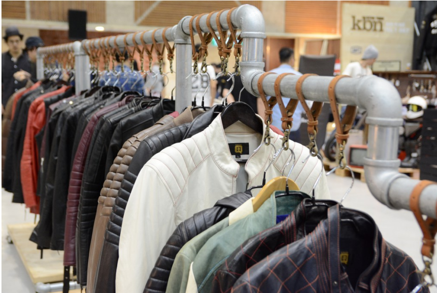
除了重機展示外，代表騎士精神的皮衣也在場內販售，店家利用水管和皮飾吊掛，為自家商品增加雅痞風。