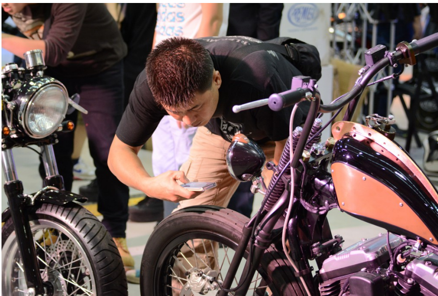
重機迷拿出手機拍下車體細節，捕捉改裝車的輪胎紋路。