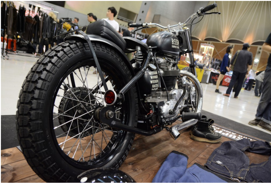
Ride Free 5展覽除了展示重型機車之外，還有不少屬於重機的周邊商品在旁陳列展售。

由雜誌社主辦的重型機車展「Ride Free 5」，於二〇一四年十一月三十日在五股工商展覽館盛大展開。現場展示不少稀有車種，提供民眾近距離欣賞的機會，同時也集結全台各地的車友們擺攤販售周邊商品，以宣揚街頭玩車文化。