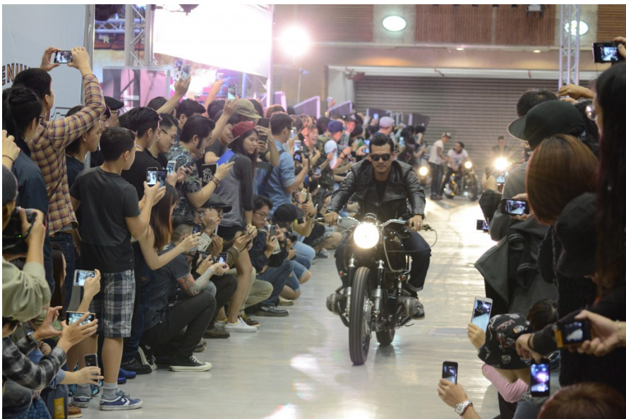
中場的Ride in Show吸引民眾聚集在走道兩邊爭相拍照，車友們近距離地感受重機馳騁的英姿，為展覽掀起一波高潮。