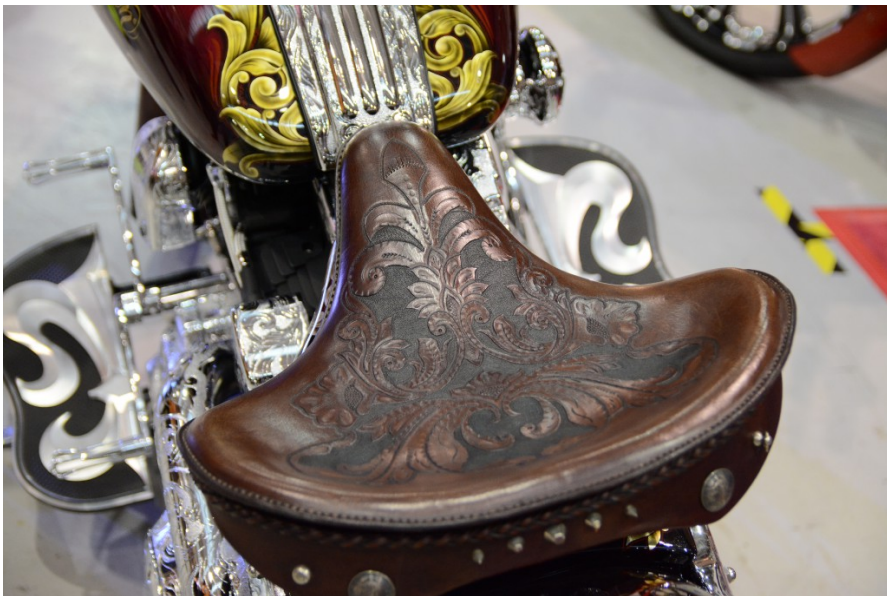
皮革坐墊加上精美雕飾的花紋，增加了識別度和個人風格。