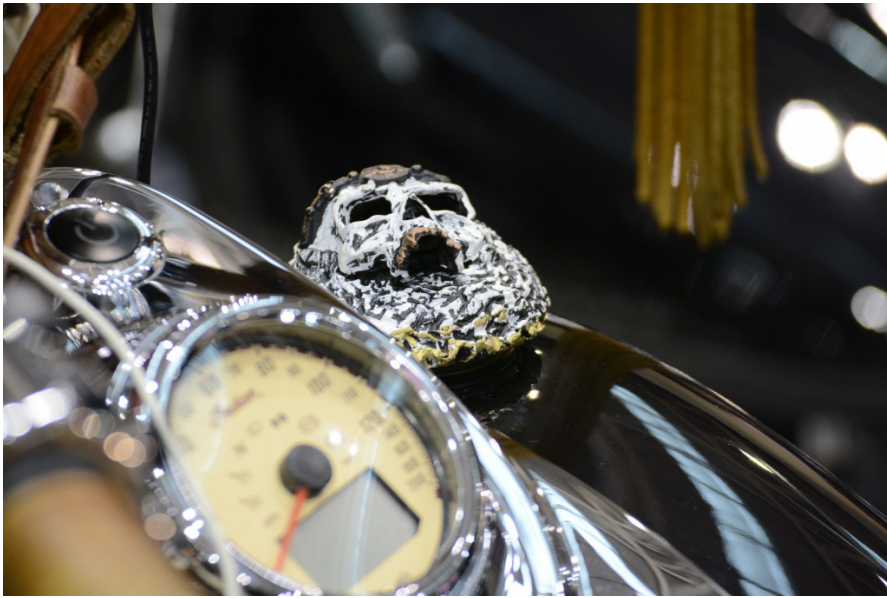
引擎箱上裝上骷髏頭裝飾，替車身畫龍點睛，並提升車體美感，讓重機變得搖滾起來。