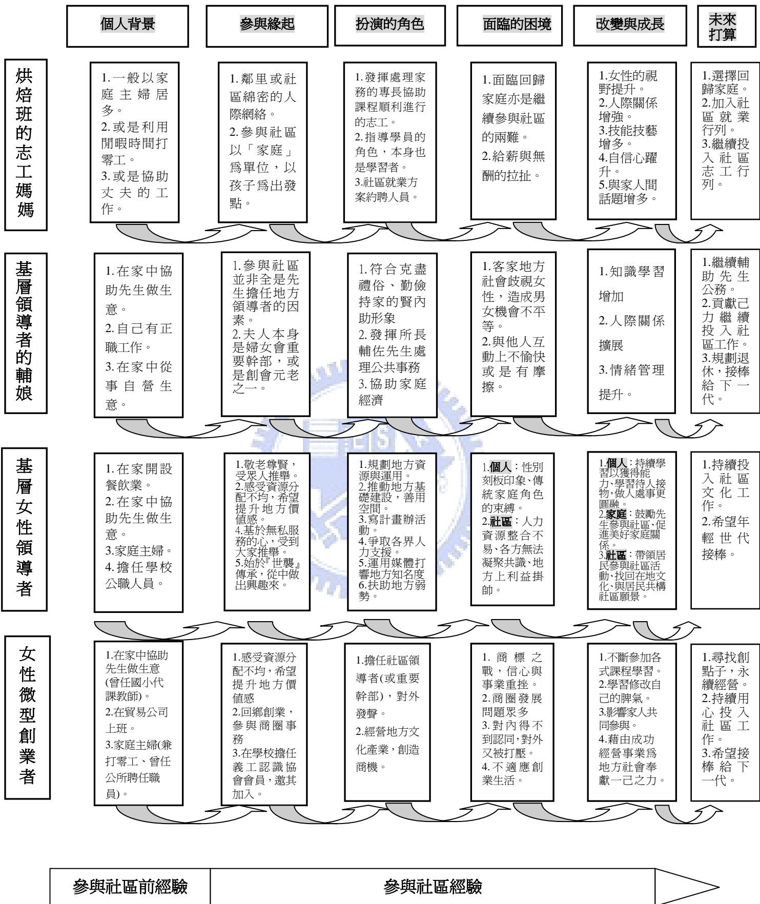
圖 7-1 橫山鄉女性參與社區的歷程圖繪