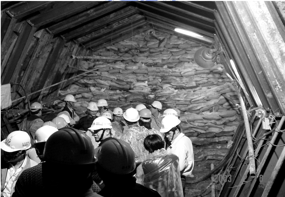
圖 5-24 全斷面堆置袋裝砂包及水泥包 (亞東醫院北端工作井下行隧道內)