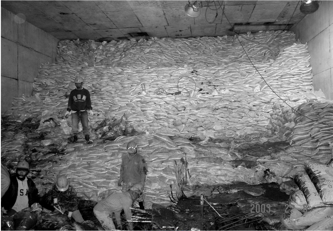
圖 5-23 全斷面堆置袋裝砂包及水泥包 (府中站隧道出口)