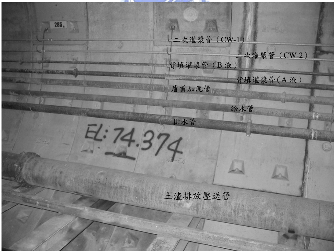
圖 7-12 隧道內部各種輸送管線