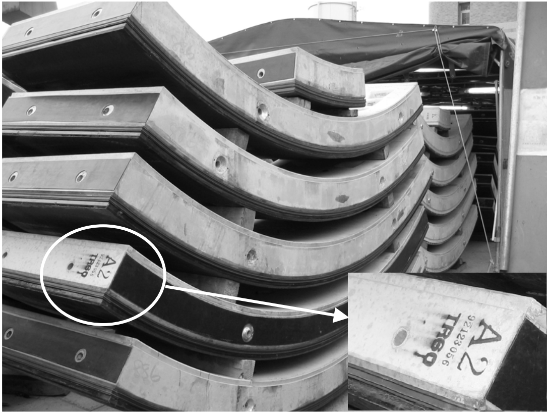
圖 7-9 異形量 60 mm 之環片