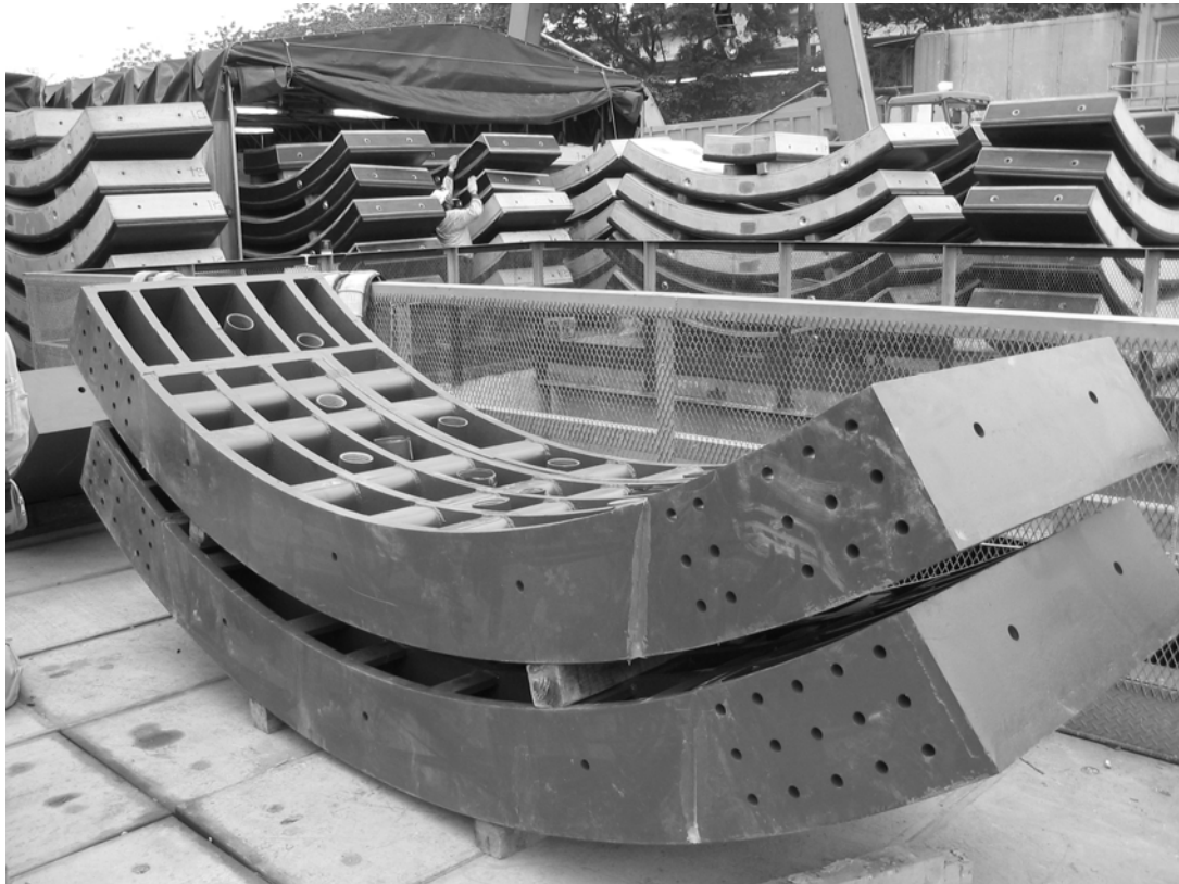
圖 7-11 鋼製環片（聯絡通道處使用）