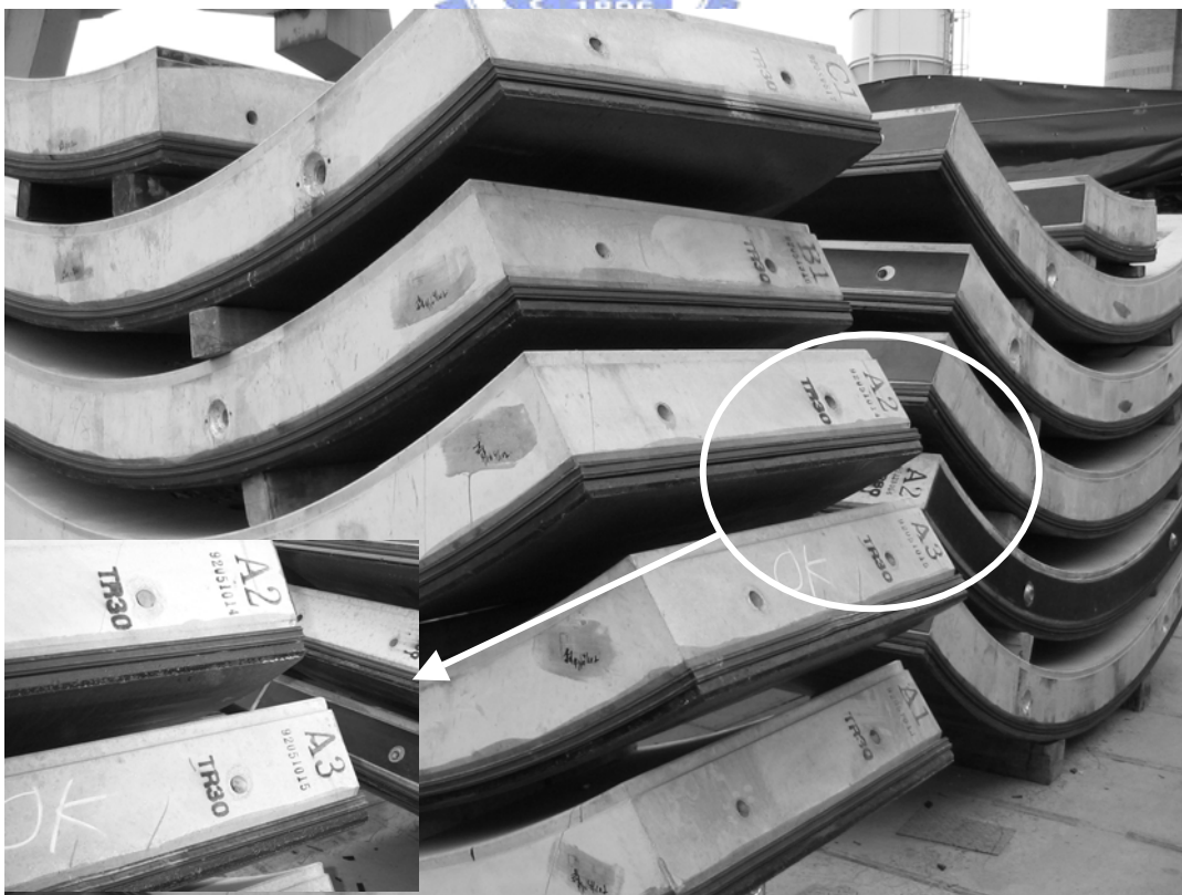
圖 7-10 異形量 30 mm 之環片