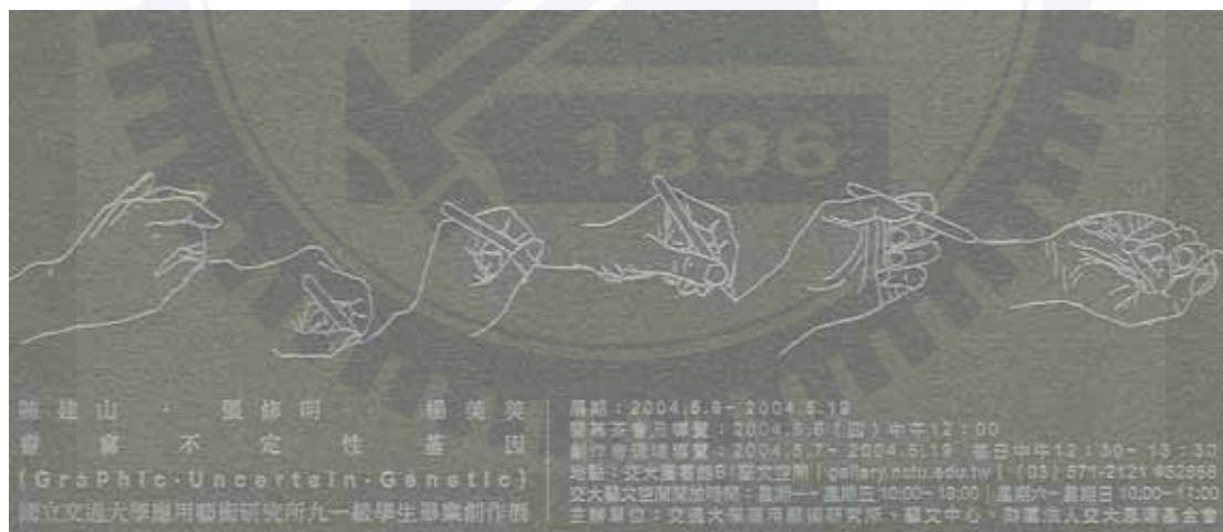
(圖 3-2) 書寫・不定性・基因 Graphic・Uncertain・Genetic 請柬卡片

突變、變形、交異、混合……；而來自客體的深層結構的省思，有待我們以一種反思情境去解讀，所有的現象是不定性的？或只是表象的？因為人詮釋後的結果，我們都在詮釋，從表層到裏層，就怕別人不了解，除了堆砌，還是堆砌，事實上是這回事嗎？那麼什麼才是物件原型的，那種不用解釋的圖譜——讓我們重返視覺化的圖譜，一種對視覺隱喻的關照。