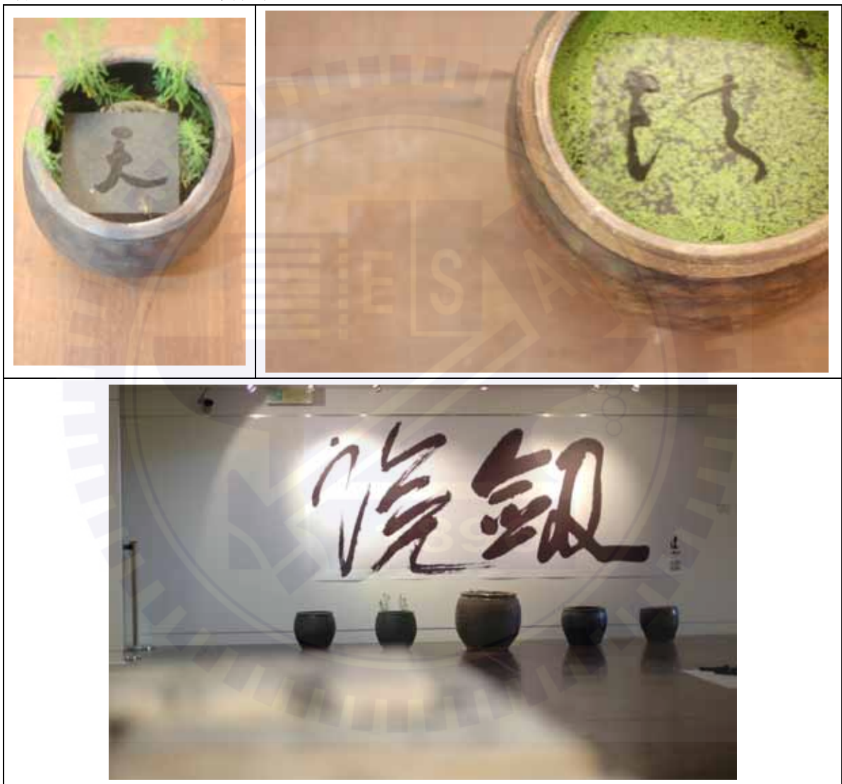
作品一：《說劍》複合裝置