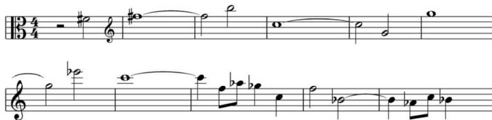
譜例 1.3 (蕭斯塔高維契，第五號交響曲，第一樂章)

另外，中提琴也在蕭斯塔高維契的弦樂四重奏裡佔有重要的地位。在第一號弦樂四重奏中，蕭斯塔高維契安排中提琴在無伴奏的情況下奏出一段親切感人、憂鬱，風格近似俄羅斯民歌特點的旋律。