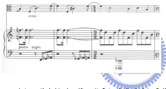
譜例 2.40 (蕭士塔高維契，作品 147，第三樂章，第 74-76 小節)

我們之前有提到，第三樂章裡其實運用很多第二樂章的素材，如第二樂章 194 小節的中提琴裝飾奏(譜例 2.41)，在第三樂章一開始的中提琴獨奏片段裡，就有很多類似的東西(譜例 2.42)。包含連續下行的四度音程，還有運用加上經過音的三度音程。