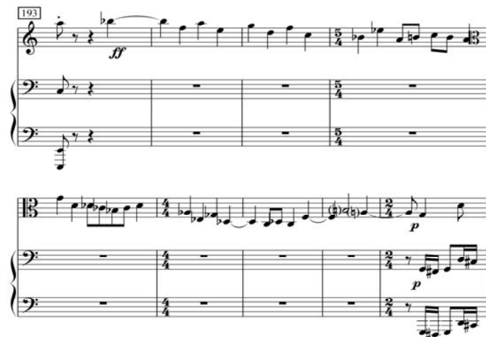
譜例 2.41 (蕭士塔高維契，作品 147，第二樂章，第 193-201 小節)

我們之前有提到，第三樂章裡其實運用很多第二樂章的素材，如第二樂章 194 小節的中提琴裝飾奏(譜例 2.41)，在第三樂章一開始的中提琴獨奏片段裡，就有很多類似的東西(譜例 2.42)。包含連續下行的四度音程，還有運用加上經過音的三度音程。