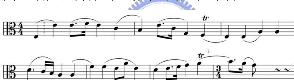
譜例 1.4 (蕭斯塔高維契，第一號弦樂四重奏，第一樂章)

在第二號弦樂四重奏的終曲裡，中提琴同樣在無伴奏的情況下演奏。蕭斯塔始終如一的鍾愛中提琴，第一號與第二號四重奏裡，把許多重要的段落安排給中提琴演奏，終曲變奏的主題，就其旋律的輪廓而言，接近於俄羅斯民歌。