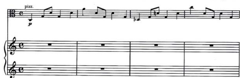
譜例 2.11 (蕭斯塔高維契，作品 147，第一樂章，第 1-4 小節)

在 159 小節，鋼琴的左手部分，由兩個小節的全音符 C 進行到 bD，配合著鋼琴右手，也就是先前中提琴撥奏的音型 (譜例 2.12)。