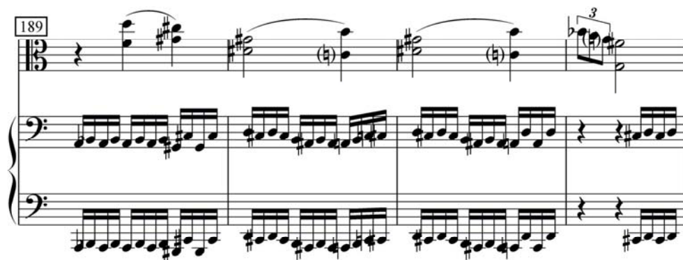
譜例 2.10 (蕭斯塔高維契，作品 147，第一樂章，第 189-192 小節)

另外，二度音程也出現於此樂章開始的中提琴撥奏樂段，第三小節的 bD 以上鄰音的方式，與中心音響 C 產生小二度的關係 (譜例 2.11)。