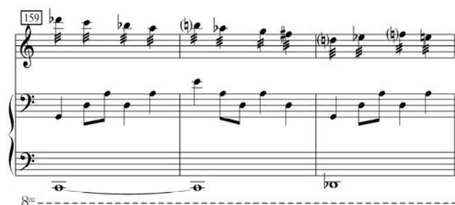
譜例 2.12 (蕭斯塔高維契，作品 147，第一樂章，第 159-161 小節)

在 159 小節，鋼琴的左手部分，由兩個小節的全音符 C 進行到 bD，配合著鋼琴右手，也就是先前中提琴撥奏的音型 (譜例 2.12)。