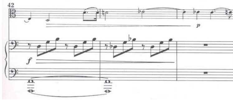
譜例 2.39 (蕭士塔高維契，作品 147，第三樂章，第 42-44 小節)

在第 74 小節，附點音符出現於鋼琴的聲部裡，並且落在小節的第一拍上。但是，若與中提琴的聲部一起來的話，它既不像是在正拍，也不像是在弱拍，它的功能就好像是結束前一個樂句，並且推動著新的樂句的發展。(譜例 2.40)