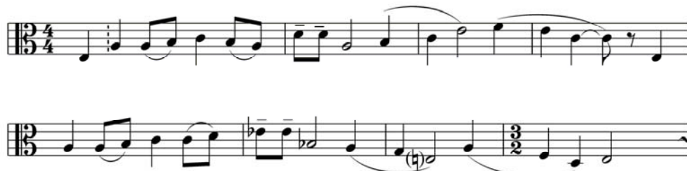
譜例 1.5 (蕭斯塔高維契，第二號弦樂四重奏，第四樂章)

在第二號弦樂四重奏的終曲裡，中提琴同樣在無伴奏的情況下演奏。蕭斯塔始終如一的鍾愛中提琴，第一號與第二號四重奏裡，把許多重要的段落安排給中提琴演奏，終曲變奏的主題，就其旋律的輪廓而言，接近於俄羅斯民歌。