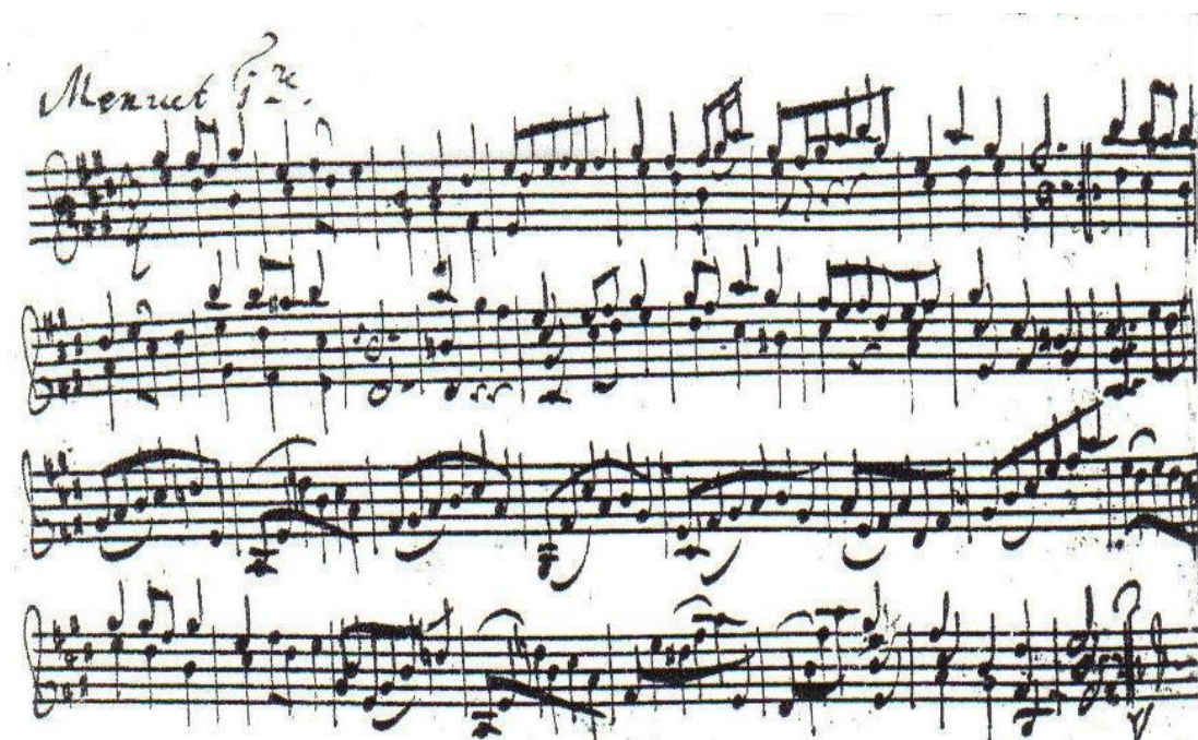
譜例 29, 巴赫小提琴無伴奏第三號組曲, 小步舞曲 I, 第 29 至 32 小節