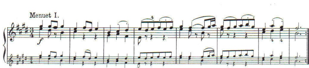
譜例 27, 巴赫小提琴無伴奏第三號組曲, 小步舞曲 I, 第 1 至 8 小節

本段落通常會以 p 的力度從頭反覆一次，四分音符也會相對的以較輕而短的方式演奏。