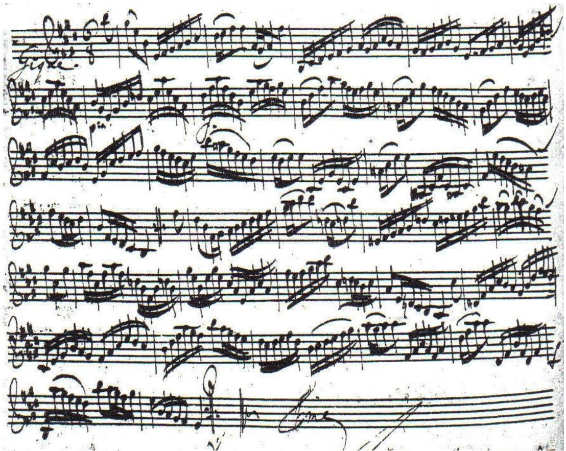
譜例 34, 巴赫小提琴無伴奏第三號組曲, 吉格舞曲, 第 1 至 32 小節

在開頭的 1 至 16 小節手稿中，巴赫以圓滑線來表示音的方向性，因此在運弓的分配上，要特別避免因弓速過快而導致圓滑線裡最後的音無弓可用，而造成音量上突然的變弱和音樂上的中斷。m.6 的 p 和 m.7 的 f 需要以弓使用長度和拉奏位置的改變將力度變化明顯的表現出來(譜例 34)。