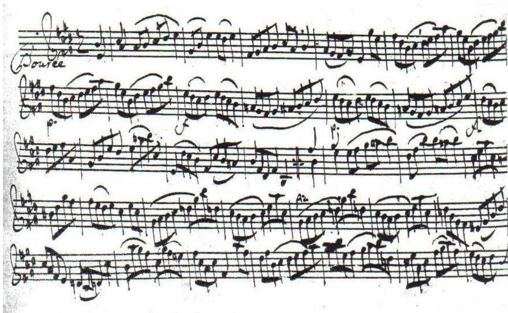
譜例 33, 巴赫小提琴無伴奏第三號組曲, 布雷舞曲, 第 1 至 36 小節

本樂章可分為兩個大段落，以同樣鮮明而流暢的單旋律貫穿全曲。第一段為 1 至 16 小節，以兩小節為一小樂句，本曲幾乎沒有太多的節奏變化，在第五小節之後，巴赫特別標示以大小聲輪流拉奏旋律，來豐富樂曲的音樂性(譜例 33)。第 17 小節之後的第二段則是樂章開頭兩小節為轉調後的模仿，32 小節則回到原調，於主題再現後結束本樂章。其作曲手法以及素材的運用與小步舞曲 I 很相似。在演奏上，本樂章通常與下一個吉格舞曲接連演奏，使布雷舞曲明快而活潑的性格能延續至吉格舞曲，另一方面則是避免因以曲長較短的吉格舞曲作為整首組曲的最終樂章而使整組作品顯得頭重腳輕。