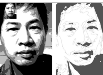
▲進階只有一個輔助色階