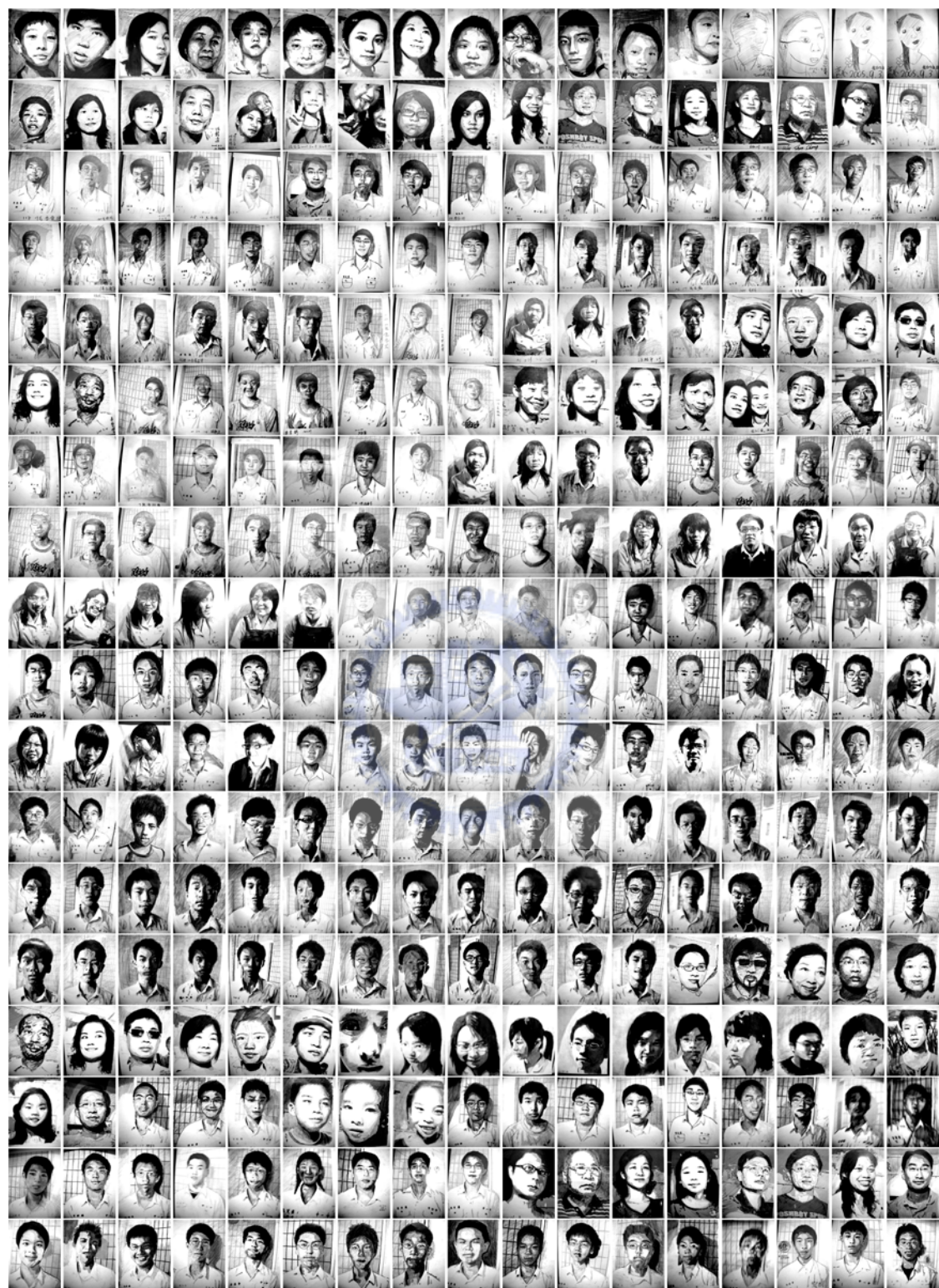
圖 50 ▼ 觀眾自畫像的集合