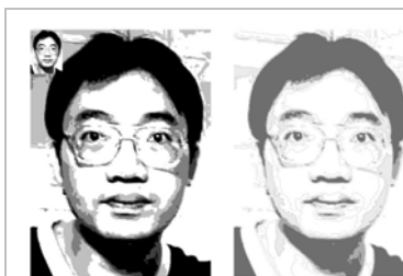
▲初級有二個輔助色階