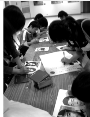
圖 46▲觀眾正在畫自畫像