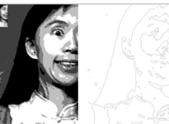
▲高級沒有輔助色階