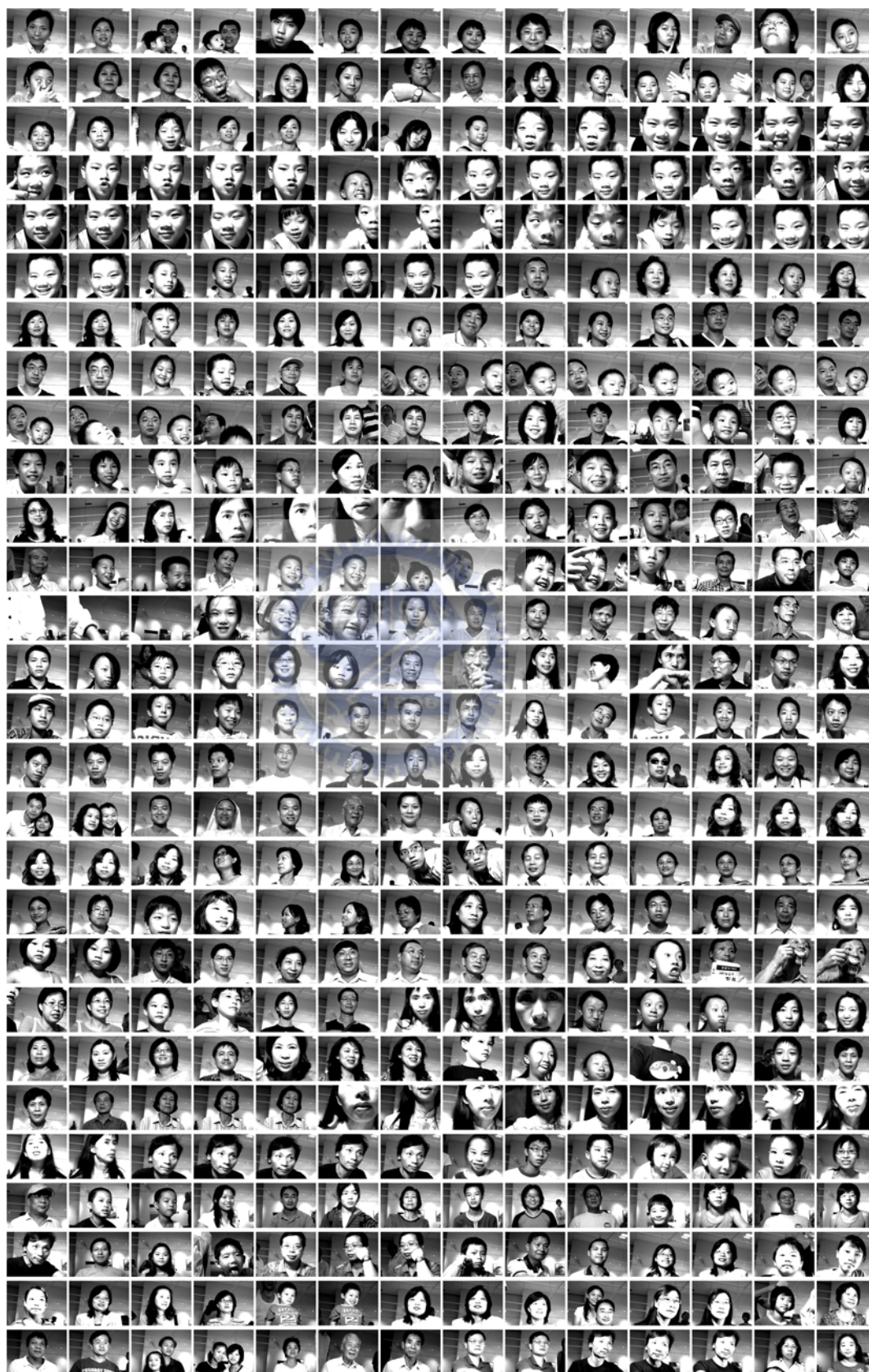
圖 43 參與的觀眾自拍留下的影像