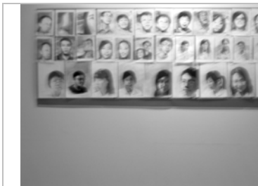
圖 48 觀眾互動自畫像展出的情形