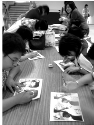
圖 45▲觀眾正在畫自畫像