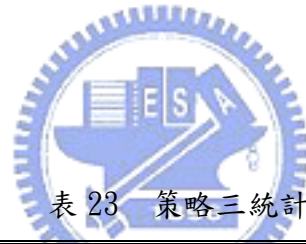
表 23 策略三統計檢定