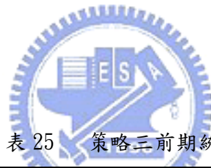
表 25 策略三前期統計檢定