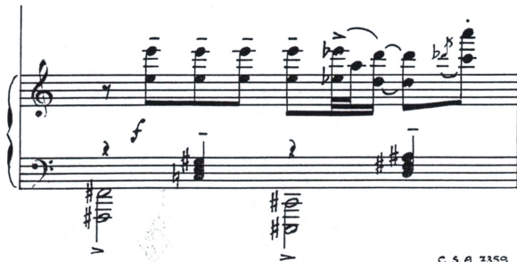
譜例五十九 鋼琴與低音管的主題齊奏(mm.150)

鋼琴在一百五十二小節的最後一個音時回到了i樂段的主題，而接下來i2樂段從第一百五十五到一百五十七小節開始就像是先前h樂段的濃縮：先以第一百三十九到第一百四十一小節的內容濃縮出現在一個小節，(譜例六十)接著回到了第一百三十四到第一百三十五小節的內容以更為緊湊的方式出現(譜例六十一)。