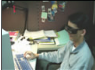
圖 3-12 受測者