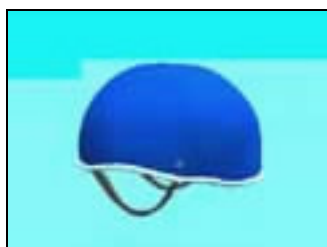
圖 3-2 虛擬原型—安全帽