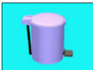
圖 3-3 虛擬原型—垃圾桶