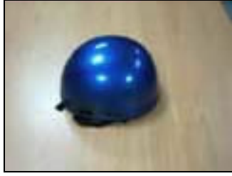
圖 3-9 實體原型—安全帽