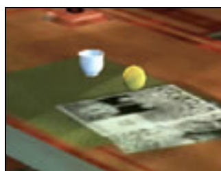
圖 3-5 虛擬原型—黃色球與杯子