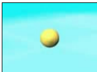
圖 3-1 虛擬原型—黃色球