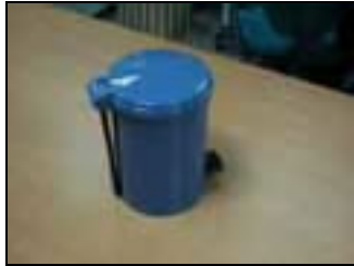
圖 3-10 實體原型—垃圾桶

實驗總共由 60 位不同的受測者,分成四組進行,每組實驗有 15 位受測者來進行產品尺寸的評估。