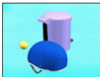
圖 3-4 虛擬原型---球、安全帽、垃圾桶 實驗場景三