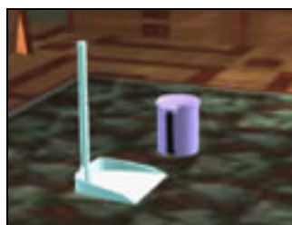
圖 3-7 虛擬原型—垃圾桶與畚箕 實驗場景四