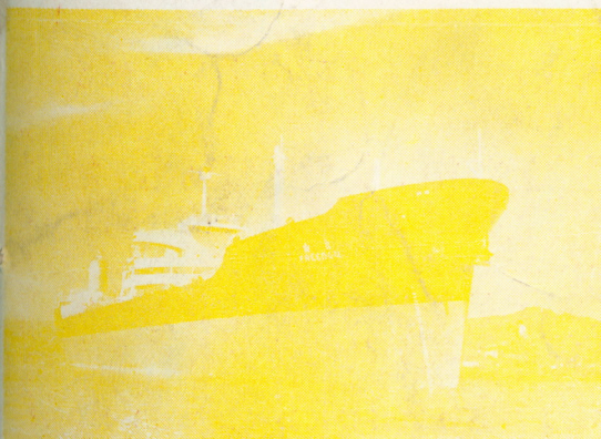
超級油輪自由號 S/T "FREEDOM"

通用油輪公司所屬「信仰」及「自由」號超級油輪，係姊妹型，分別于四十八年十一月及四十九年八月建造完成于基隆般台造船公司。現航行中東臺灣及中東歐洲。船上員工多為中國籍優秀船員，其服務成績向為外籍人士所稱道。