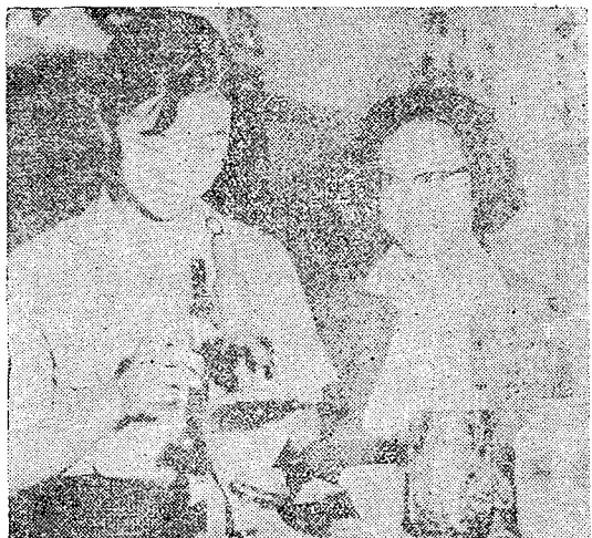
忙于試驗之中葉學長之長次子女公