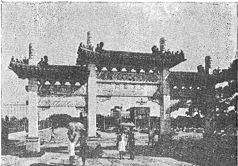
樓牌石之中園公立國非拉尼馬在 園花國中的香古色古樸彫棟畫爲卽後其