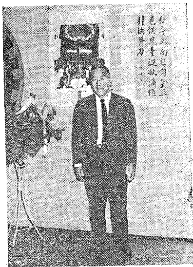
前作佳「圖糕分」於攝長學城修

量，結果傳學長很慷慨地要修澤蘭學嫂捐助貳千元，作為印製影展目錄費。我們效「投桃報李」，於目錄封底，為其義務宣傳花園新城——修學嫂設計的理想住宅區作廣告。