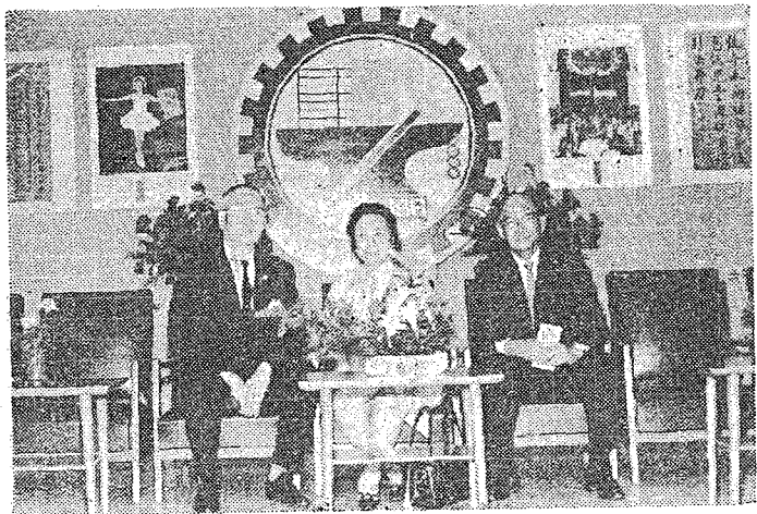
僑伉長學（左）貞耀朱、芳樹王日旅 觀參同陪長學天樂徐由