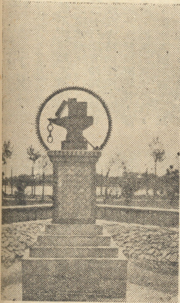
民十九級建贈母校噴水池背景