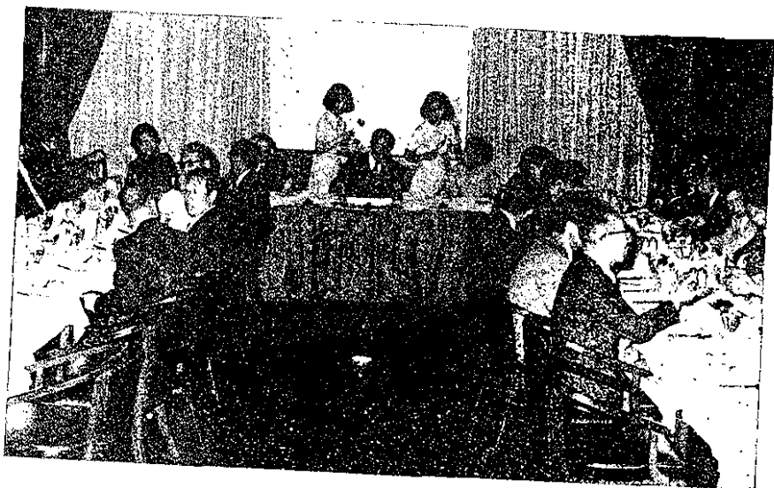
論討績繼叙餐後會