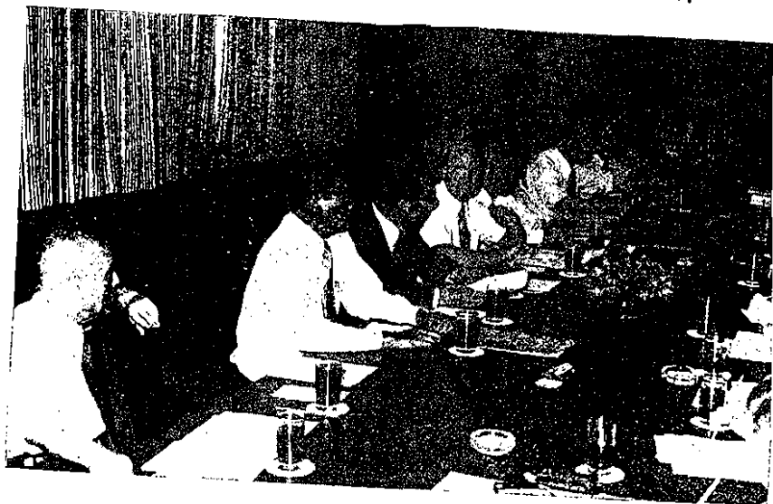
言發烈熱移遷否是大交論討為