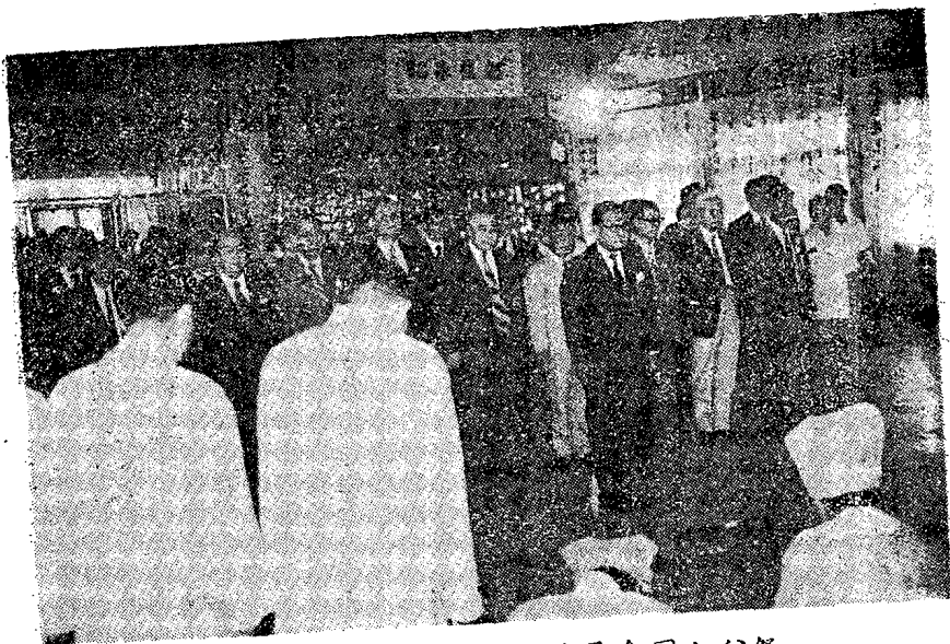
教育部蔣部長率同治喪委員會同人公祭