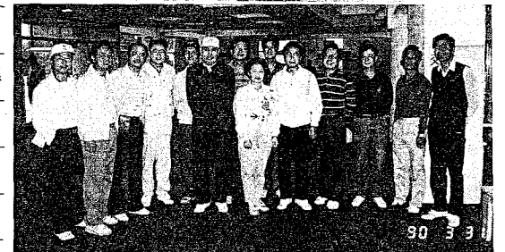
照片 2: 參加高爾夫球賽之校友合影