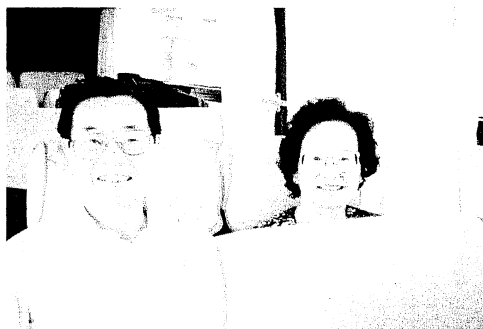
趙錫成學長夫婦很高興能參與盛會