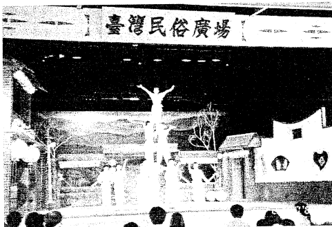
民俗特技表演令眾人嘖嘖稱奇

石門水庫的「活魚五吃」是有名的，多少老饕專程自全省各地前來，只為品嚐這新鮮的美味。我們在這家裝潢的古色古香的餐廳享用晚餐。「魚肉嫩得像豆腐，不錯。」每一道都是魚，魚身、魚尾、魚頭，煎、煮、炒、炸，還能拿來燉湯，久居異國的學長姐們忍不住大快朵頤。「在國外也常吃中國菜，但那味道不道地，這次回來真有口